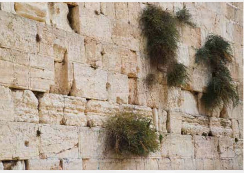
שיח הצלף הגדול שבצורת הגברים