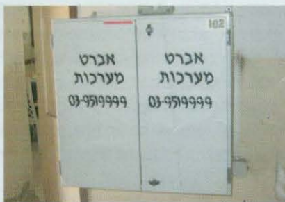
גבעת חיים - קופסת המערכת הסגורה

אנחנו מרוצים מההסדר, המערכת שהמחלבה התקינה, עובדת יפה וללא תקלות וההכנסה הנוספת מכסה את עלות העבודה וההתארגנות."