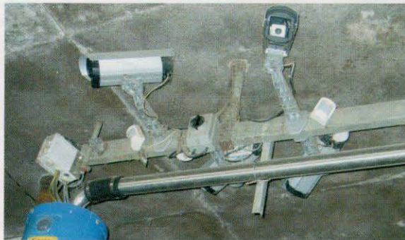
ארבע מצלמות עוקבות אחר המתרחש במכון הקרוסלה בגבעת חיים מאוחד

במחלבות ובמוצרים הנמצאים תחת השגחת בד"ץ העדה חרדית ירושלים וכן במוצרי המהדרין במחלבות רמת הגולן, מוגדר חלב מהדרין באופן שונה מכל שאר המקומות