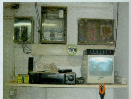
אלון קמה - מערכת הווידאו

מכון החליבה אוסף את הנתונים לקיום הרפת, בחליבה רואים את הפרה הצולעת, את זו שיורדת בחלב, או פצועה ורגישויות נוספות שרק רפתן רואה. מספר "הרפתנים" הולך ומצטמצם וזו סכנה לקיום הענף. ■