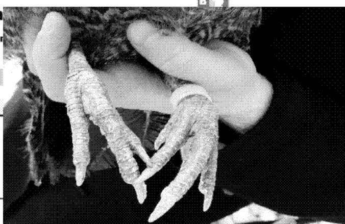
תמונה מטבעת על רגל בראקל