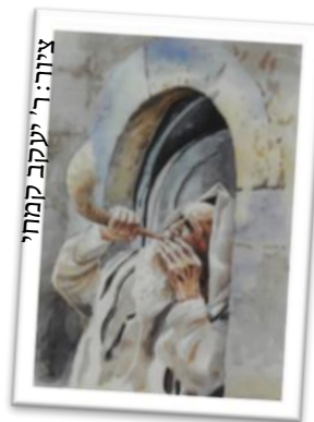
ציור: ר' יעקב קמחי

ואז מגיע המפץ: "ובכן תן פחדך", "זיאתיו כל לעבדך". כל-כך לא התכוננתי לזה. זה לא ברשימת הבקשות בפנקס.. ואז, מיד לאחר התפילה אתה פותח כמה ספרי מחשבה ומגלה, כמה בלתי-יאומן, שבכלל מהותו של יום הוא התגלות כבוד ה' בעולם וקידוש שמו בפי כל ברייה. "שתמליכוני עליכם". ואתה מיד מנענע עצמך: אופס, איך כל זה נעלם ממני?