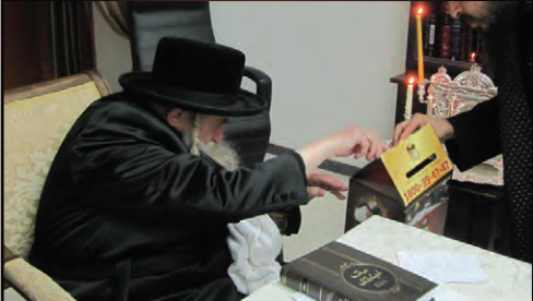
כ"ק מרן האדמו"ר מטשערנובורג שליט"א תורם לקופת העיר בעת הדלקת נרות חנוכה

כל השמות שמגיעים כל יום מימי החנוכה עד השעה 3:00