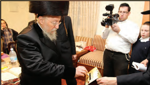
כ"ק מרן האדמו"ר מביאלא שליט"א תורם לקופת העיר בעת הדלקת נרות חנוכה