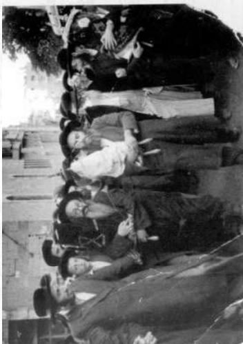
בתהלוכת מחאה ברחובות עיר הקודש

הגאון הראב"ד שנשם כל ימיו אור פסגו של עמל בתורה ויראת שמים, היה רחוק מהנאות עוה"ז כרחוק מזרח ממערב. ג. פועלוֹתיו הציבוריות למען הכלל בהנהגת הידות החרדית ובית הדין של העדה.