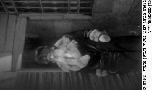
בצאתו מביתו לבסע בעליו (עפ"ל) ששלח לו מרחן מסאטמאר זצ"ל

יש בנחת טעם לתאר בקצרה מעט מקשרי הגאון הראב"ד עם מרחן הרב"ח זוננפלד, רבה של ירושלים, והערכות ההדדית נצטט את מכתבו של ראב"ד ירושלים מרחן המהרי"ץ דושינסקי להגאון הראב"ד (מתאריך כ"ז אב תרצ"ו). הובא בקובץ "דבר ההתאחדות שיע"י", תלמיד ישיבת דושינסקי, תשרי תשס"ב, בו רואים את הערכתו המופלגת שלו להגאון הראב"ד כשבאגודתו זו הוא מבקש מהגאון הראב"ד להיכנס לעובי הקורה במערכה