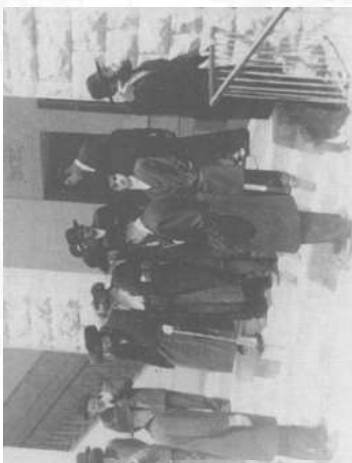
יוצא מביקור אצל כ"ק מרן הגאב"ד מהר"ם דושינסקיא זצ"ל

הראב"ד, סיפר שכנו הרה"ח ר' ישראל עוזר על הדלות הנוראה ששררה בבית הגאון אקדוטה מעניינת מביקור זה. המלמדת