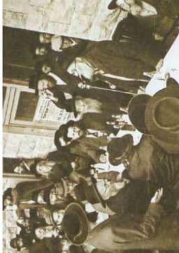
נואם בהנחת אבן הפינה ב"שיבת בית יוסף" צב