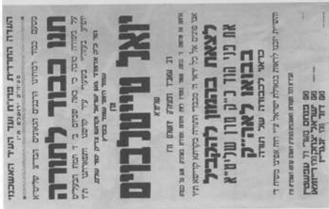
כרז מטעם הראב"ד זצ"ל ובית דיון להקביל מרחן מסאטמאר זצ"ל