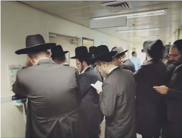
התרופה היעילה היחידה היא תפילה. מתפללים ליד חדרו של מרן זצוק"ל במעיניו הישועה

ממנו, אבל מה השייכות לבינה וגבורה, והפי' הוא שסביבת הלומד תורה מקבלת ממנו כוח וגבורה". אפשר לומר כי הדרגות האלו היו נראות ביום יום?