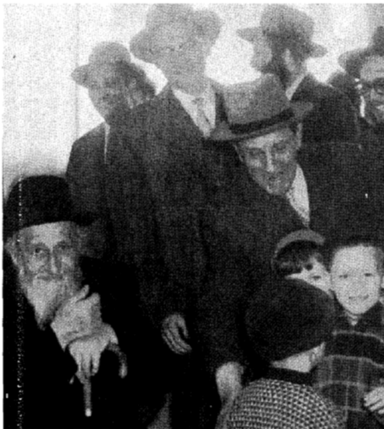
בעת ביקורו של מרן הגר"י מבריסק בצוק"ל במונטריי

לשבת ולא אכל מאומה ביום, אלא רק בלילה. לעיתים היה צם שלושה ימים ושלושה לילות רצופים מבלי לאכול, בערב בשנות מלחמת העולם נודע בישיבה כיחיד שלא נטל עיתון לידו משל כל התקופה כדי לדעת חדשות הוא שקע בד' אמות של הלכה בלבד.