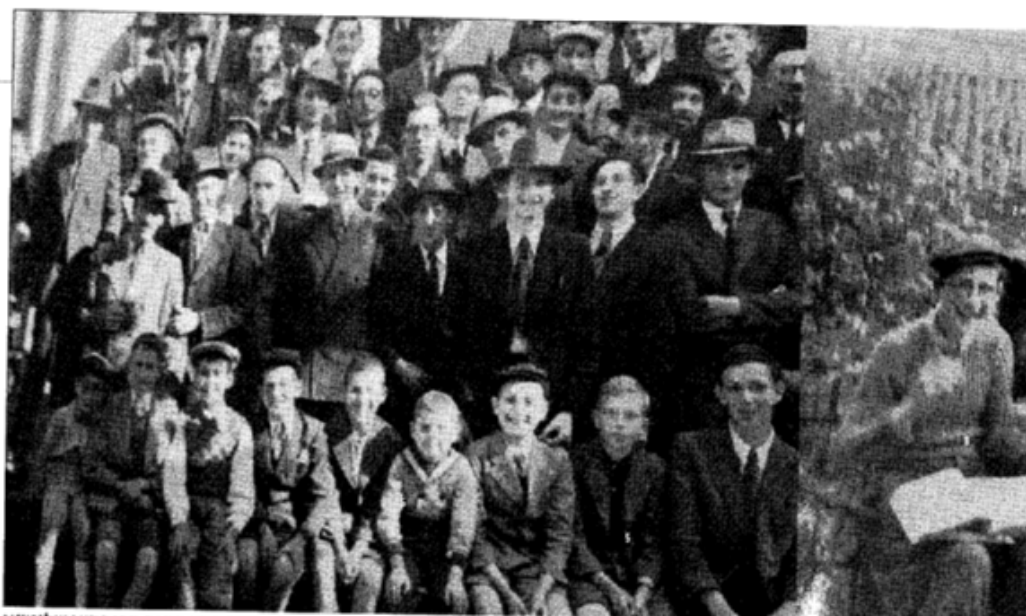
תמונה מיוחדת שהצטלמו בה כל בני הישיבה לרגל נישואי אחד ממיוחדי הישיבה - בפתח הישיבה, ונפקד תמונה מרן רה"י שליט"א (אח"י 1234567) אוצר החכמה

כרגן רמשים ותולעים זעירים, ולכן הם חוששים לאכול זאת. ואכן כל אימת שהם באו לאכול מין ממיני הדגן, הנהיגו בישיבה ששמים את כל הדגן לפני הבישול על מחבת לכמה דקות עד שהדגן השחים, והרמשים הפכו להיות אפר, וכך יכלו לאוכלו.