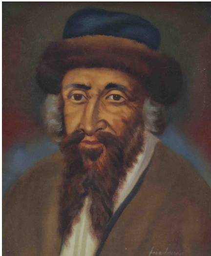
דער גאון וקדוש בעל חכם צבי