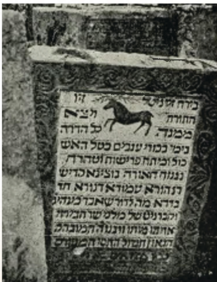
א היסטארישע בילד פון די מציבה פונעם חכם צבי אין לעמבערג

נאך א קורצע תקופה, ווען ער האט געפירט א מלחמת חורמה קעגן די רשעים פון כת ש"צ ימ"ש, האט מען אים אנגעהויבן שטארק צו רודפ'ן און ער האט געמוזט פארלאזן אמשטראדאם, און נאך פסח פון יאר תע"ד האט ער זיך געצויגן מיט זיין משפחה קיין פוילן. נאכן וואוינען אין פארשידענע שטעט אין פוילן, האט מען אים אין אנהויב שנת תע"ח אויפגענומען אלס רב פון די גרויסע שטאט לעמבערג, אבער ער איז דארטן געזעצן אויף די כסא הרבנות בלויז געציילטע חדשים ווען ער איז פלוצלינג נסתלק געווארן א' אייר תע"ח. ווייניגער ווי א יאר דערויף, ג' שבט תע"ט איז אויך נפטר געווארן זיין רביצין הרבנית שרה רבקה ע"ה.