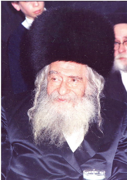
הארה יוקדת לכל אחד רבינו ה'פני מנחם' זי"ע

פעם שאל אחד את פי קדשו, בענין מה שמצינו בספרים הק' שבכל פעם מגדירים ש'העיקר' הוא ענין