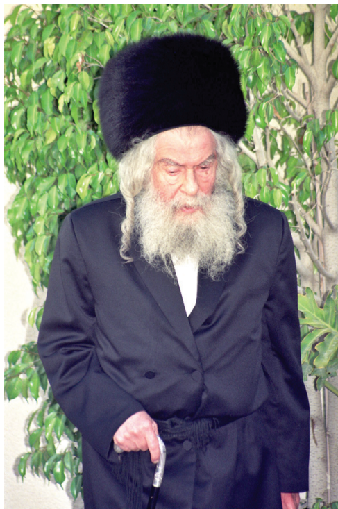
אמונה ובטחון, הוראת חיים לכל העוברים סף מפתח