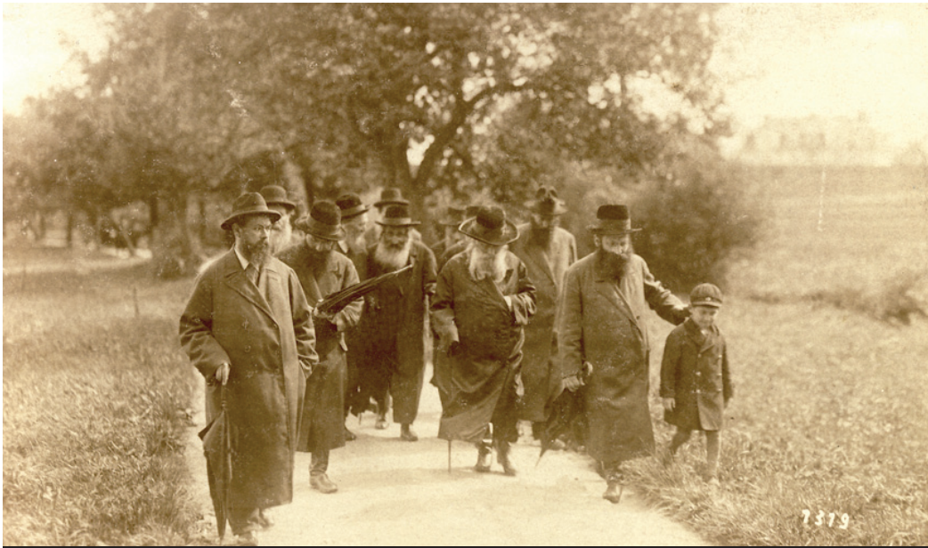
רבינו ה'פני מנחם' זי"ע (בילדותו) עם אחיו כ"ק מרן אדמו"ר ה'לב שמחה' זי"ע במחיצת אביהם ראש גולת אריאל כ"ק מרן אדמו"ר ה'אמרי אמת' זי"ע

הנכנסים אשר באו להקביל את פני קדשו, נכנסו במורא רבם כמורא שמים — והנה ה' ניצב עליו, שם שמים שגור על פיו, והוא מרומם את ההסתכלות אל השי"ת, לאמור: זיכרו את ה', שוא תשועת אדם, ראו את ידו ית' בכל תהלוכות חייכם.