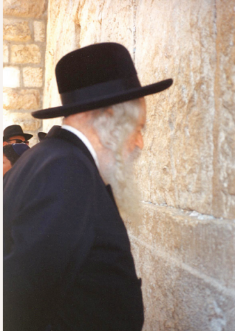
רבינו זי"ע בכותל המערבי

עוד הגיד, כי מי שאינו רואה שכל חיותו היא מהשי"ת — כמקרא מלא שדיבר הכתוב "כי לא על הלחם לבדו יחיה האדם, כי על כל מוצא פי ה'..." — הרי הוא בגדר 'סומא' שעליו אמרו חכמים ז"ל (יומא עד): "סומים אוכלים ואינם שבעים", כי ע"י שידוע שכל חיותו ממוצא פי ה' בא לידי שביעה.