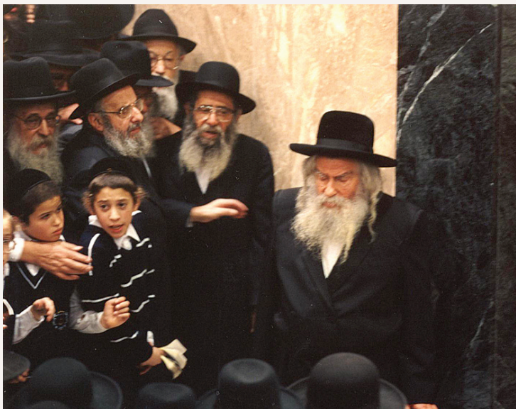
רבינו ה'פני מנחם' זי"ע בביקורו באמריקה

ואף כאשר באו לפניו אנשים כאובים שהפסידו את רכושם בענין רע, היה מפיסם את רוחם ומזכירם כי ביד השי"ת להשלים להם את הכל. וכדברי חזקוני נוחם שדיבר על לב יהודי אשר הפסיד