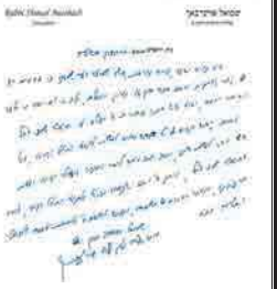
מכתבו נגד חיסוטי שכבי ברח' אבא אבן בירושלים - חשון תשע"ה

שמואל באמרו"ר גאון ישראל מוה"ר שלמה זלמן זללה"ה אויערבאך