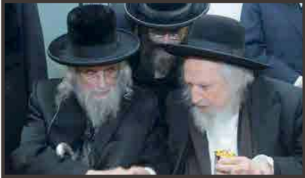
בשמחת נישואי א ממקורביהם