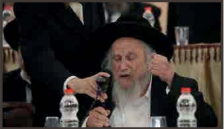
נואם בכינוס מאתיים רבנים נגד ההתייצבות