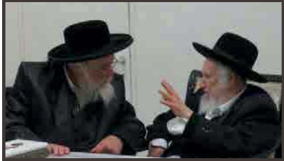
כ"ק אדמו"ר מתולדות אהרן שליט"א בביקור בביתו