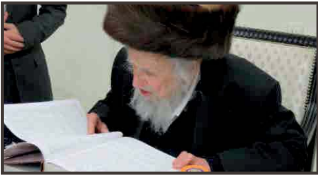
באהבת ישנה תמיד

יגיעתו בתורה ובעמלה עד כלות החושים היתה נדירה, עמל ויגע בעבודת ד' בצורה שהפליאה כל רואהו כשם שהפליאה שקדנותו שלא ידעה גבולות והתמדתו שלא היה לה שיוור. כל רגע היה מנוצל אצלו ללימוד תורה בעמל ובעיון עצום ונשגב, בעומק עד אין חקר, עד שהגיע לפסגת ההבנה ודרכי הסוגיא האירו לו באור יקרות. שעות השינה שלו עמדו על שעות ספורות בלבד מדי לילה כבר מגיל צעיר.