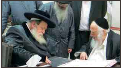
כ"ק אדמו"ר מתולדות אברהם יצחק שליט"א בביקור בביתו