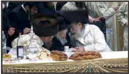
בשמחת נישואי נכד כ"ק האדמו"ר מתולדות אהרן שליט"א