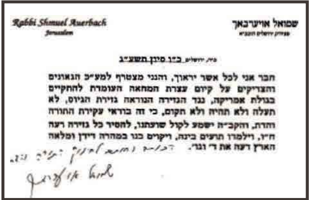
מכתבו לעצרת המחאה במאנהעטן נגד גזירת הגיוס - סיון תשע"ב

איש, יצא ממעונו ברחוב אבן שפרוט 3 לעבר בית המדרש הגר"א רחבת היכל ישיבתו "מעלות התורה" בשכונת שערי חסד, כאשר מאות אלפים מכל העדות והחוגים הגיעו לחלוק כבוד התורה, בראשות גדולי ישראל וראשי ישיבות, רבנים ואדמו"רים, מרביצי תורה ויושבי על מדין ובראשם רבינו הגדול מרן הגאב"ד והגאון"צ חברי הביד"צ שליט"א.