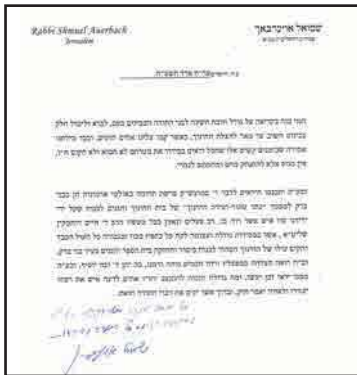
מכתב עוז - אין מנוס אלא להתנתק מהם ומהמונם לגמרי - ב' אדר תשע"ח

הגדולה ספג אל תוכו כל הימים, וכך תיאר את לימודו בילדותו על אביו "אזכרה ימים, בשנת ההפלאה טרם לאיש הייתי, ואז למדני אבא מארי זללה"ה מסכת ביצה, בנוסף על לימודי בהת"ת, בחדרו המיוחד ללימודו בבית ד' בלילות, ומול עיני דמות דיוקנו אז בעת לימודו ופניו פני להבים, כאשר כל מעייניו וחושיו