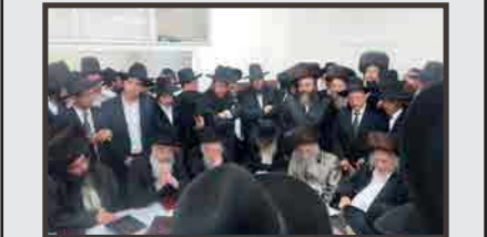
מרן הגאב"ד שליט"א בביתו רה"י זצ"ל בכינוס הסיום של ארגון "וכתבתם"