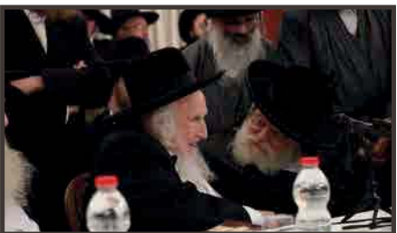
עם כ"ק אדמו"ר מתולדות אברהם יצחק שליט"א

ויר"ש אכן היו מן המפורסמות, בעולם היהודי נודעו לשם דבר השיחות שנמסרו מדי ליל שבת קודם תפילת מעריב ומדי רעווית דרעווית. אלפי אברכים ובני תורה, ראשי ישיבות ורבנים, מרביצי תורה ויושבי על מדין, בעלי בתים ופשוטי עמך בית ישראל, השתתפו במשך עשרות שנים, במשאות הנודעים שזעזעו את לב השומעים. כמה מפליא היה לראות צורבים צעירים, לצד יהודים באים בימים, המגיעים לשמוע את המשא שנאמרו מפיו בעוז ובגבורה, ושאפו לחזות בעת תפלתו מדי יום ובשבתות ומועדים, בימים נוראים ובחגי השנה. שם ראו את "עבודת התפילה" ביגיעה ובסילודין, באימה וביראה, בבכי ובתחנונים, כעבד המרצה את אדוניו.