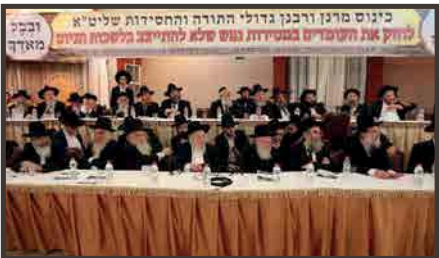
בכינוס מאתיים רבנים נגד ההתייצבות בלשכות הגיוס