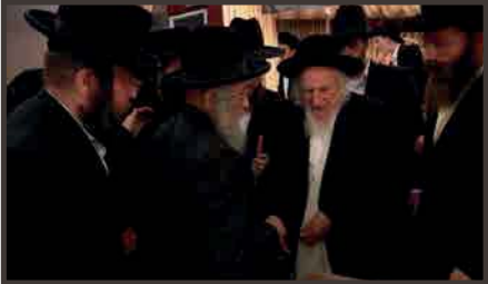
עם כ"ק מרן הגאב"ד שליט"א