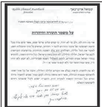
מכתבו למפגן הרבבות