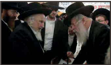
עם חבר הכיכר הגא"י אולמן שליט"א