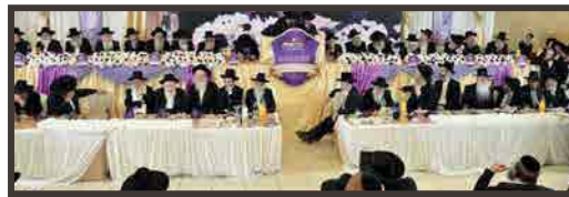
בועידת כתר טהור