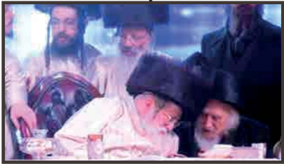
בשמחת נישואי נכד כ"ק האדמו"ר מתולדות אברהם יצחק שליט"א