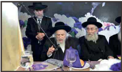
במשא הצוואה לדורות להתנתק מהם ומהמונם לגמרי - ב' אדר תשע"ח