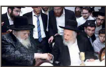
בסיום כתיבת ספר תורה