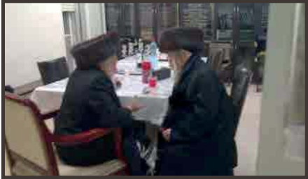
בסוד שיח בביקור בביתו בערשק - אדר תשע"ג