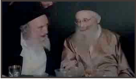
בשמחת נישואי נכד מרן שליט"א