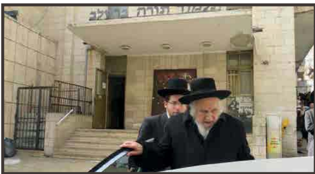
ביציאה מביהמ"ד הגדול ברסלב במא"ש

אפרים זצ"ל כי באחד השנים פנה אליו הגרא"ז מלצר ביום הושענא רבה בהתעניינות היכן ילך להשתתף בהקפות, ונענה כי