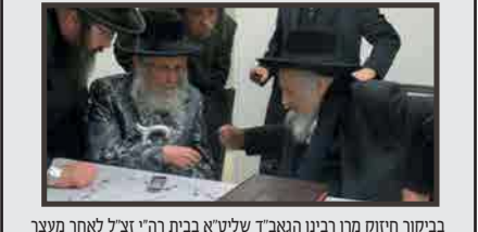
בביקור חיזוק מרן רבינו הגאב"ד שליט"א בביתו רה"י זצ"ל לאחר מעצר עסקני בני תורה - ניסן תשע"ז