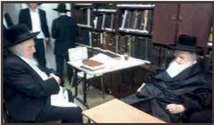
בניחום אבלים אצל הראב"ד שליט"א