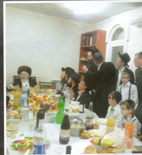
לאכל מחוללו. שמחת פורים במעונו

אור חדש ניצת והבזיק בחדר הלימוד. אלו ה'ממתקים' שלו בעולם אפרפר גדוש תככים וסיבוכים. אלמנה קשת-יום אין ערוך לה בשעת בוקר כזו, לאחר לילה תמים עם דיני 'השקה'. עיניו העצומות-למחצה נפקחות לרווחה