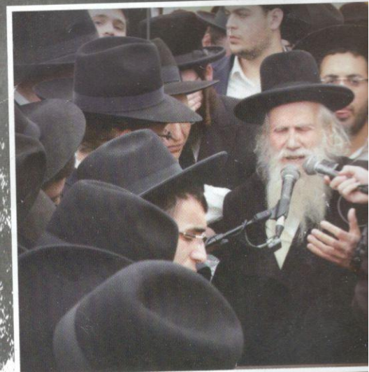
אשכנתי דרבי. אחיו הגר"ע מספיד בהלווה. ההמונים ברחובות ירושלים. אחיו הגר"ד מספיד