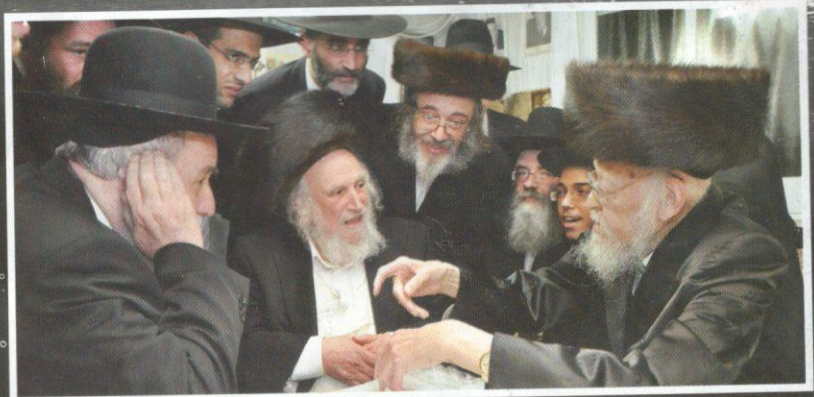
בציאל דמהימנותא. עם מירן הגר"ש אלישיב < הגרא"ל שטיינמן > הגר"ע יוסף זכר צדיקים לברכה