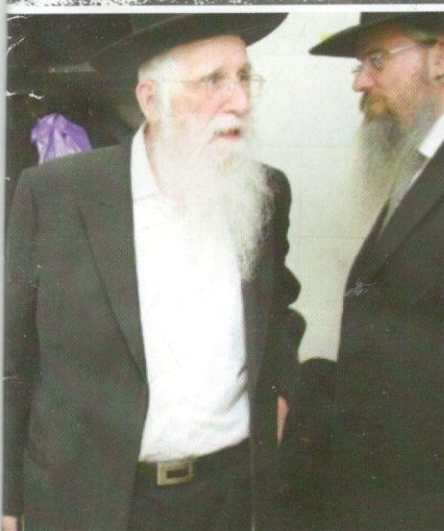
שמחה של מצוה. עם יבדלח'ט אחיו הגר"ע לקראת אפיית מצו

...הטייתי את אוזני. האלמנה הגיעה להיוועץ