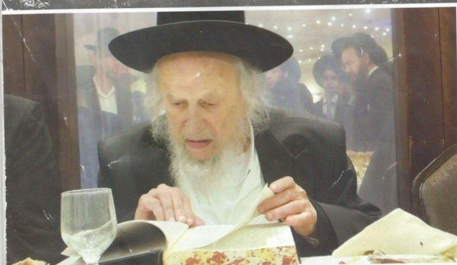
ובתורתו יהגה בכל רגע. יגע על התורה בשמחה