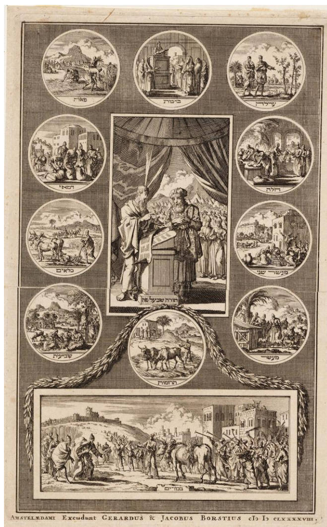
סדר זרעים - פיתוח נחושת במהדורת משנה עם תרגום לטיני - אמשטרדם, 1698-1703

"ובעל כף נחת עשה להם סדר במטעמים אשר הטעים במקצתו, אבל גם בזה לא כוון להלכה, ואזכור מהם. שבין ראש השנה לתענית סידר יומא וסוכה, ובהדיא אמרו בגמרא דריש תענית: תנא מראש השנה סליק. מסכת ביצה סידר אחר חגיגה, והתוספות בפרק שני דחגיגה דף כ"ז הוכיחו דביצה מתניא קודם חגיגה. מסכת סוטה סידר אחר קדושין, ובגמרא דריש סוטה: תנא ממסכת נזיר קא סליק..." 48 .