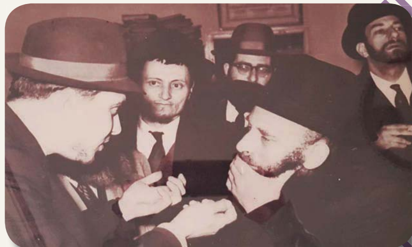
עם הנרא"א מישקובסקי ובלחט"א הרב"מ אורחי

אם הם פסולים בגבהותם, למה קיבלו שכר? רואים, אמר רבי אורי, נכון שכונתם הייתה לשם שמים ולכבוד שמים ולכן באמת קיבלו את שכרם וזכו שיתרבה כבוד