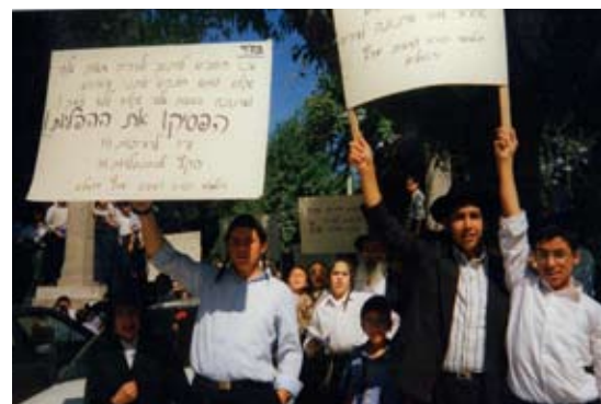
במחאה נגד העיריה

באסיפה הרצה ר' רפאל את הבקשה לפני המסובים, ואז הוא הבחין בפתקים המתגלגלים מאיש לרעהו בין היושבים בשולחן. אחד הנוכחים עפעף בעיניו לר' רפאל ורימז לו