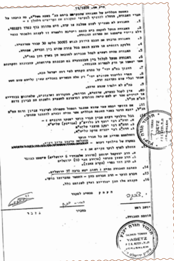
התקנות של הת"ת