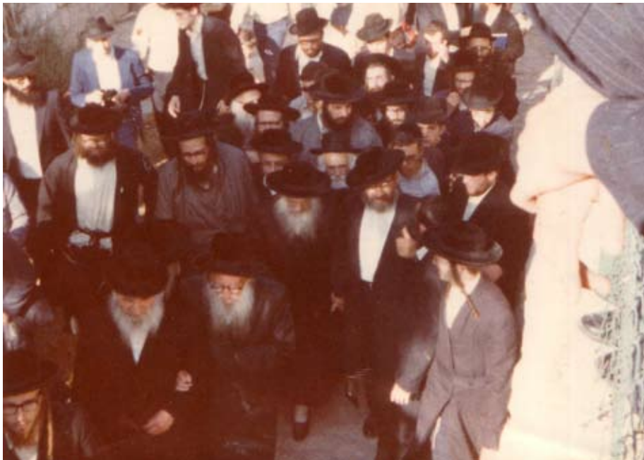
עם האדמו"ר בעל הברך משה מסאטמאר זצוק"ל בביקורו בארה"ק. מלווה בבנו יבלח"ט רבי בעריש שליט"א

דווקא משחיטה כזו וגם הכשרים אחרים אימצו לעצמם את הענינים הללו עד תומם. נוסף לכך היה הוא עצמו נוסע לפקח על סדרי השחיטה, בימי בחרותי שגרתי בביתו הייתי מצטרף עמו לפעמים בנסיעותיו לפקח על שחיטת הגסות במשחטה שהיתה בעיר חולון בזמנו. פסקיו בעניני שחיטה הם נר לרגליהם של בני היהדות הנאמנה.