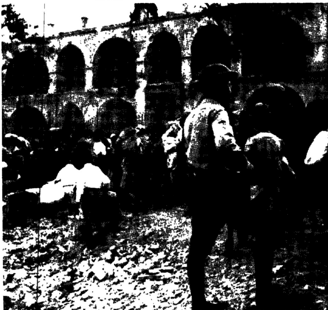
בית רוטשילד, בעת עזיבתו בי"ט אייר תש"ח

חבית מים על כן, עם ברז וקערה. חדר אחד לקבלת אורחים, ולאחריו חדר נוסף, כדי לקיים את דברי הסוברים, כי גם בני-הבית ישנים בסוכה.