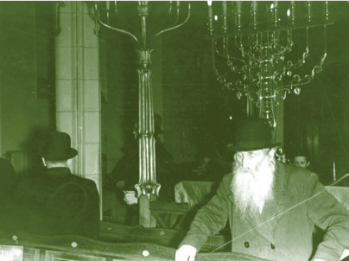
בית הכנסת ברחוב פאווה בשואה