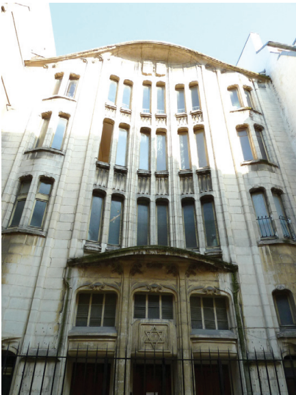
בית הכנסת של אגודת הקהילות ברחוב פאווה

רבי יואל עדיין לא זכה לראותו, אך מפי השמועה למד על הופעתו הפשוטה, קומתו הנמוכה, וזקנו שגם הוא אינו יורד על מידותיו, מעילו פשוט וכך גם כובעו, ועיניו מפציות אור, תום, אמת ואהבה.