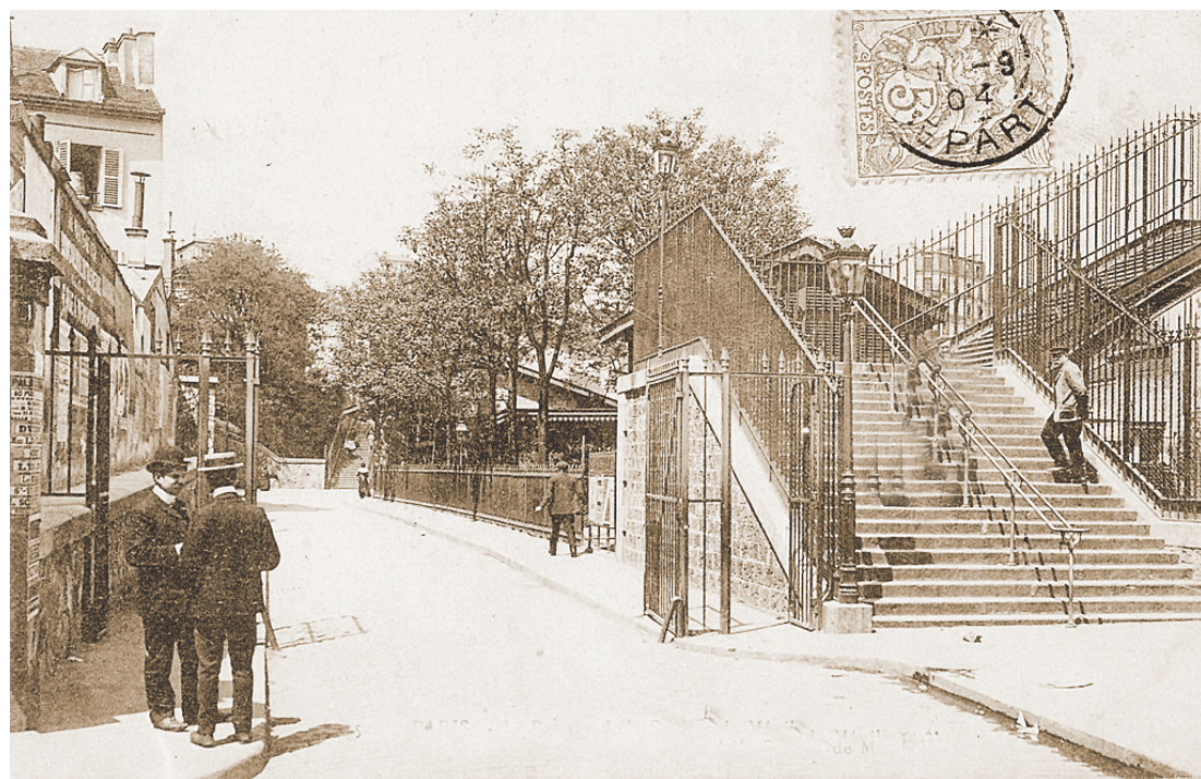
תמונה מימי עבר: יהודים ברחוב בפריז

מאחר ואנו מצויים בעיצומה של עריכת ספר על פאריס של מעלה, בהפקת מכון "למוד אגדה", בשנים שטרם מלחמת העולם השנייה, וכן בשנות המלחמה, ובשנים שלאחריהם, נבקש מכל מי שיש תחת ידו חומר תיעודי פריטים על הנ"ל, לשלחם לדוא"ל: ialbert10@gmail.com פלא 0527641561.