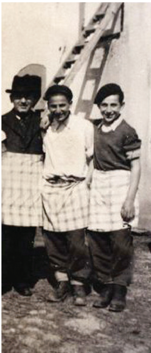
באפיית מצות של משפחת רודל

ר' ישראל יהושע ז"ל, נולד בווארשא למשפחת חסידי גור וזכה בילדותו לקבל ברכה ממרן ה"שפת אמת" זיע"א. לאחר נישואיו התגורר בעיר מלאכה וניהל עסקים. לאחר ערש"ק כשלו קיבל את ברכת מרן ה"אמרי אמת" זיע"א לעבור להתגורר בפאריס, ולערך בשנת תרצ"ב עבר לשם והקים מפעל לסריגה, ובעזרת בניו שעזרו על ידו התפרנס בכבוד. חסיד שורשי היה ונשאר ר' ישראל יהושע בכל