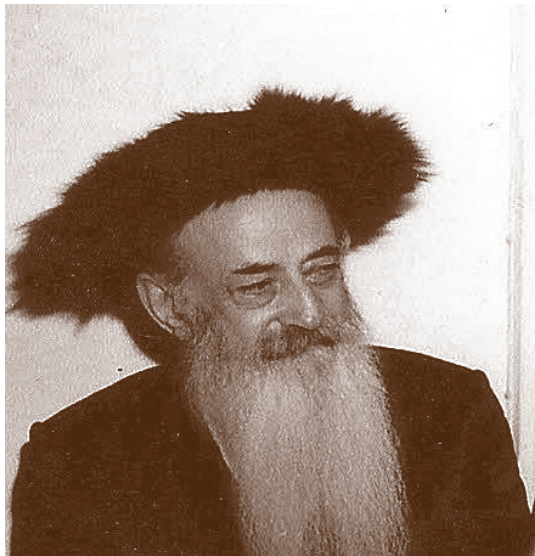
כ"ק האדמו"ר מקווינץ הרה"צ רבי ישראל אלעזר הופשטיין זצלה"ה