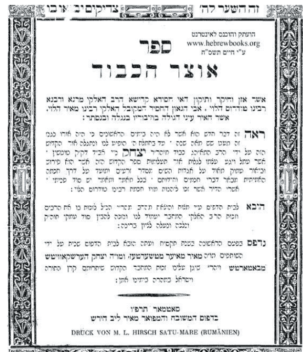
ספר "אוצר החכמה" ערשינען אין סאַטמאַר אין יאָר תרפ"ו

פונקטליך וויאָזוי מען דאַרף דאָס ליינען. דאָס מיינט אַז ווען דער דרוקער פונעם סאַטמאַרער אויפלאַגע האָט געלייגט אויבערשטרעכעלעך אַנטשטאָט פינטלעך, האָט ער פאַקטיש שאָדן געמאַכט, נישט פאַרראַכטן ווייל אַזוי קען מען דאָס בשום אופן נישט ליינען.