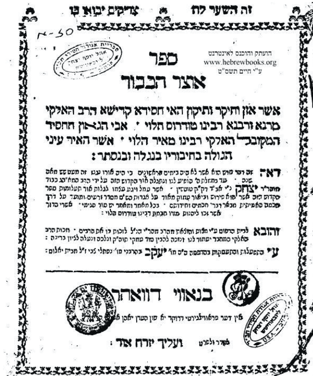
ספר "אוצר החכמה" ערשינען אין נאָווי-דוואָה, אין יאָר תקס"ח

צום ערשט, עס איז נישט קיין ראשי תיבות, נאָר אַ געהיימער "קאָד". די פינטלעך העכער די אַותיות, צייגן אַן