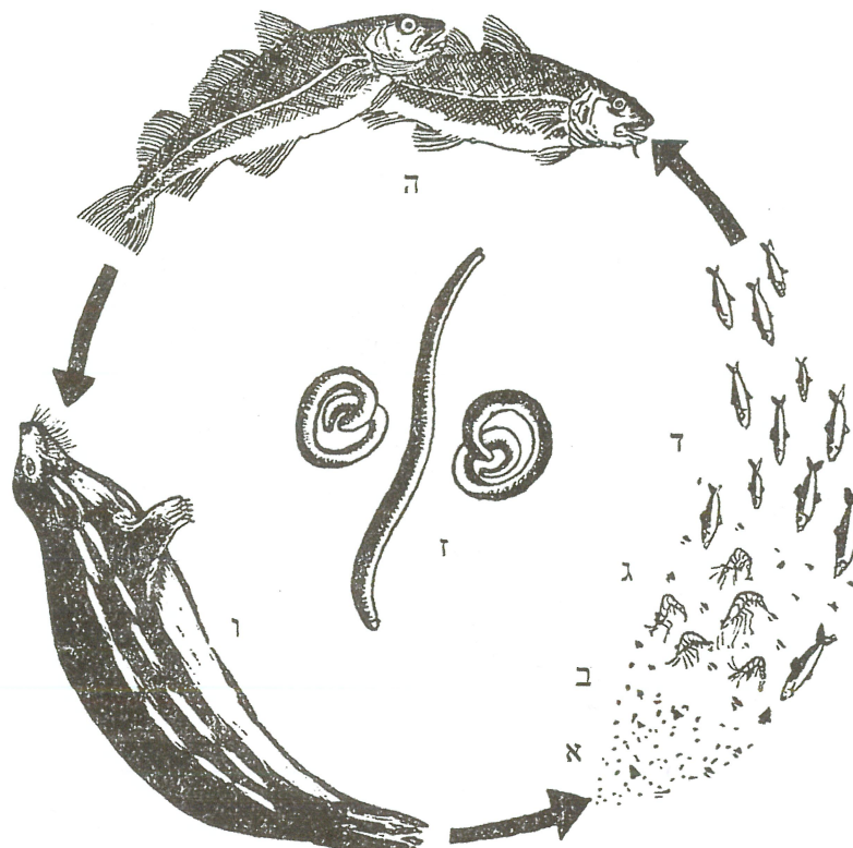
מתזור התפתחות תולעי אניזקיס

להבהרת הנושא נפרט את תהליך התפתחות תולעת האניזקיס כפי שמתואר בספרות המדעית: תולעי האניזקיס בוקעות מתוך ביצים מיקרוסקופיות בקרקעית הים ונבלעות תחילה ע"י צדפות או סרטנים קטנים, כשהתולעת עצמה בגודל מיקרוסקופי. הדגים אוכלים את הצדפות הנגועות בתולעים מיקרוסקופיות, אבל אינם בולעים את תולעי האניזקיס עצמן מהמים (ואם יבלעו אותן, הן לא תוכלנה להתקיים בדג). בקיבת הדג התולעים יוצאות מן הצדפות, מתפתחות וכשהן גדלות הן חופרות דרך דופן הקיבה ויוצאות לחלל הבטן או לבשר הדג, שם הן מתקבעות בד"כ בצורת סליל. המעגל נסגר כאשר כלב הים בולע דג נגוע ובקיבתו מתבגרות התולעים ומטילות ביצים הנפלטות לים עם הפרשותיו של כלב הים.