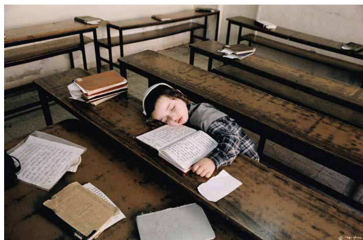
חופש אחר הצהריים - כיתה א'