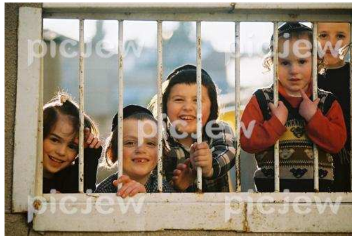
ילדים במאה שערים