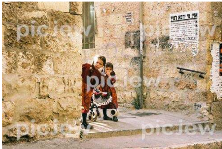
ילדות במאה שערים