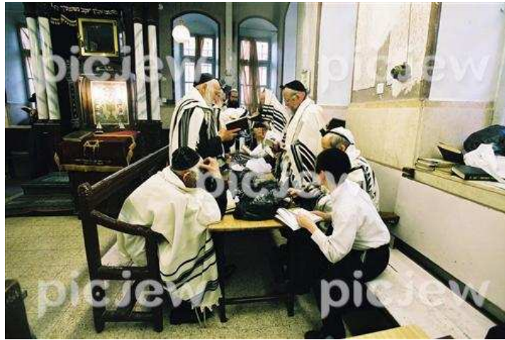
התרת נדרים בערב ראש השנה