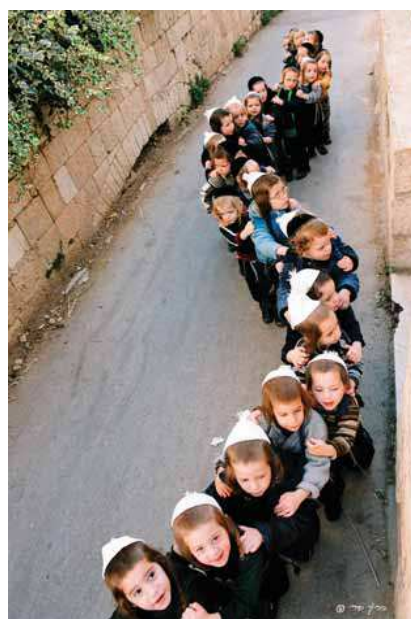
רחוב חיי אדם