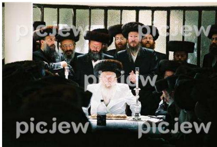
בדרך לתפילת יום כיפור