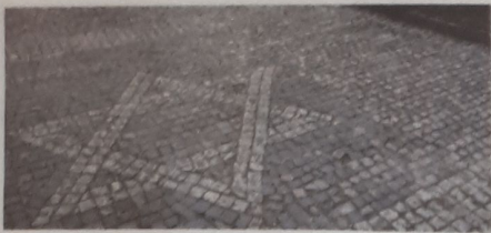
מגן דוד