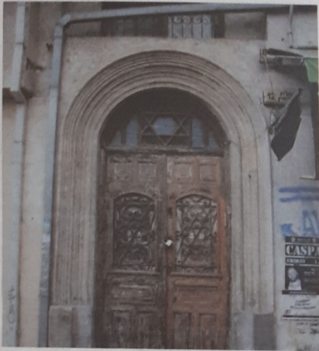
מגן דוד על בית כנסת בת"א

המגן דוד הוא סמל יהודי המורכב מ-12 כותשים (שש בלבן ושש שחור) המסובים סביב נקודת המפגש. המגן דוד הוא סמל יהודי המורכב מ-12 כותשים (שש בלבן ושש שחור) המסובים סביב נקודת המפגש. המגן דוד הוא סמל יהודי המורכב מ-12 כותשים (שש בלבן ושש שחור) המסובים סביב נקודת המפגש.