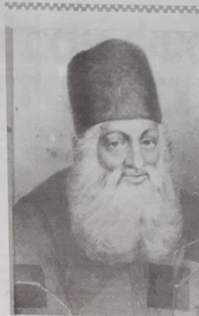
מגן דוד שהוא סגולה ומעולה שבחותמות לכל הפגעים. הגאון רבי יהונתן אייבשיץ ז"ל

אין לנו אלא לחתום בתחינה "את צמח דוד עקבך משה תצמיח, נקלנו תרום בישועתך", לא רק בצורות המגן כי אם במלכות עצמה במלוא יפעתה!