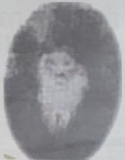
הרבי תר אחר צורות המגן דוד המעטרות את מעילי ספרי התורה, והסיר אותו עד לבלוי הכר. כ"ק מרן אדמו"ר מהר"ש מבאבוב ז"ל