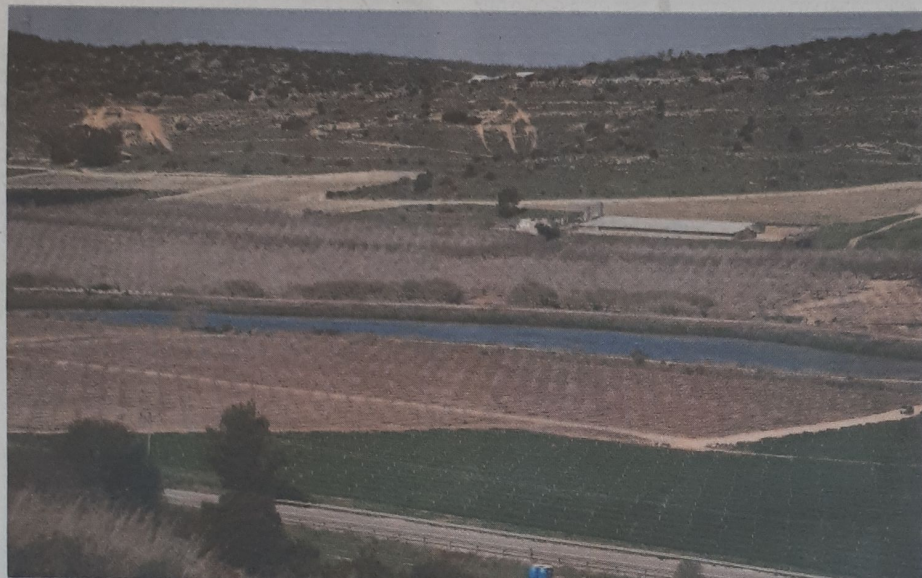
עמק האלה

המזמור כתוב ומצויר וחוקק במגנו בטס של זהב כצורת מנורה. משמע שהיה טס של זהב על גבי המגן, שהוא היה בצורת מנורה