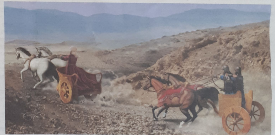
דוד במלחמותיו | ציור מלכות וקסברגר

מופיעות הוראות מפורטות איך לשרטט את הצורה לא בקווים גרידא אלא מתוך שילובי אותיות של שמות הקודש כפי שנהג הרבי רבי יהונתן.