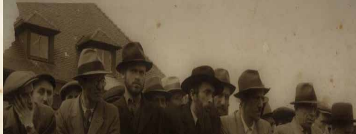
החתן שיקח את בתו יסונה לסמשיך דרכו. הגר"י גפן זצ"ל באחת האסיפות בראשית יסר כפיר אתא

"הרושם העמוק שהותיר בקריאתו ובתפילותיו ב'היכל שלמה', נותר עד היום בקרב מתפללי בית הכנסת הוותיק. עד היום בהגיע פרשת עקב, יהיו שיזכרו את 'זעתה מה ד' אלוֹקִיך שואל ממך', אותו השמיע במתיקות האופיינית לו בקריאת התורה. גם בימים הנוראים חוזרים רבים על הקט'