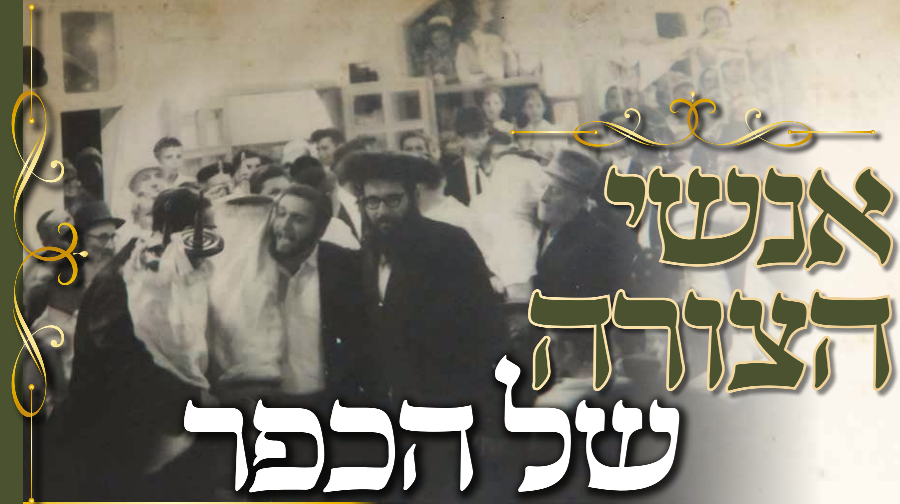
שמחה פורצת גבולות. הקפות שניות ב'היכל שלמה' בשנות קדם

אין זה פלא אפוא, כי כאשר נוסד 'היכל שלמה', הזמין אותו ר' שמעון בנש אחר כבוד להימנות בין מתפלליו ולמשש 'בעל קורא' ובעל תפילה