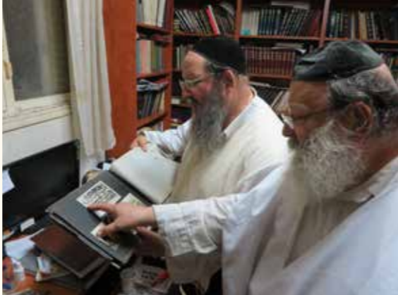
סיפורי פיקנטריה מכפר-אטא הקדומה. האחים לבית בניש בשחזור וזכרונות הוד קדומים מיום חורפם