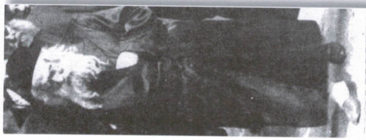
כ"ק רשכבה"ג מזן אדמו"ר מגזר ז"ע בעל "אמרי אמת"

לכן כותב המחבר שהיה מהמכורח להדפיס ספר, לכן ליקט קיצור מספר ברכי יוסף למען לחזק את מזונותיו, ושחקתני אז שהוא באמת איש אמת."