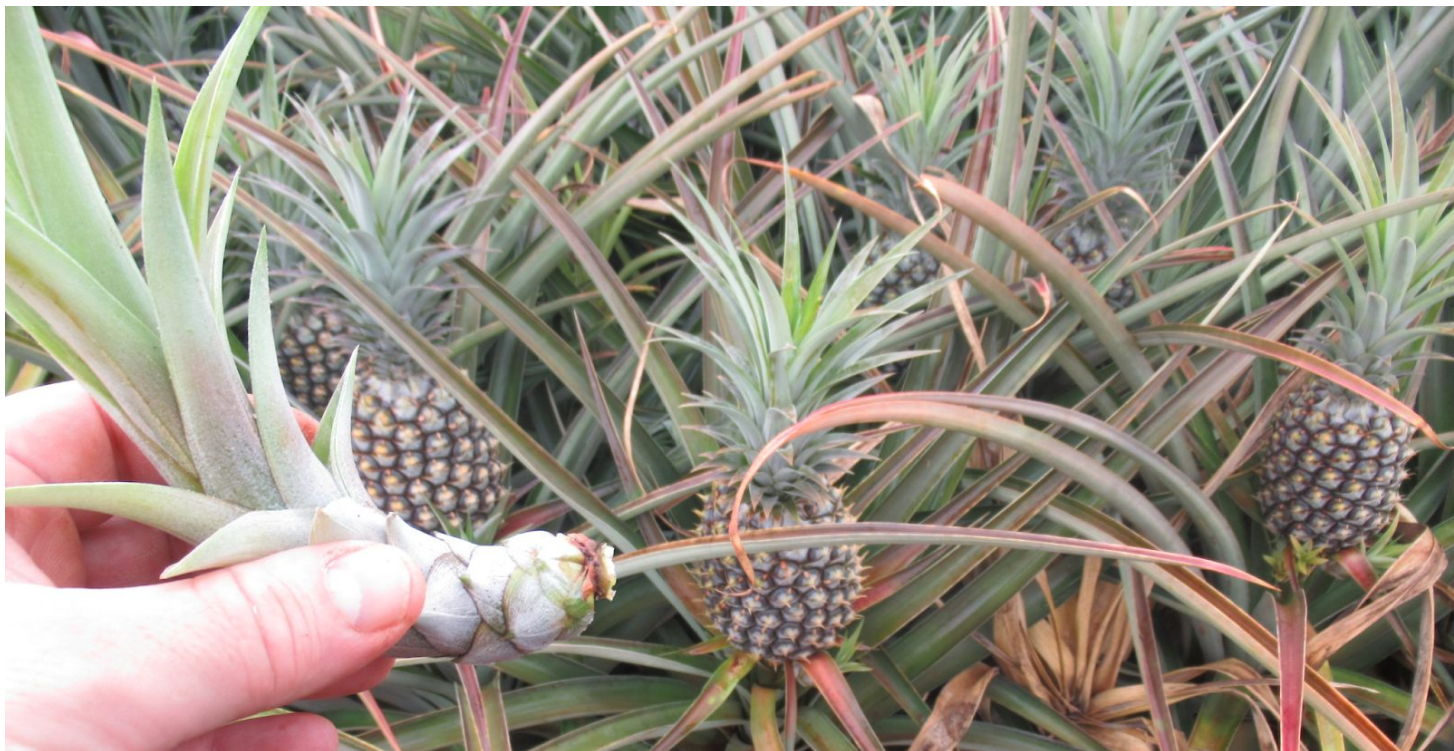
13 - העקום הוא SLIP והישר SUCKER