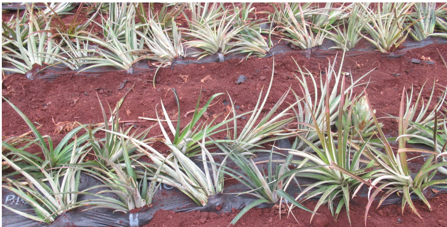
15 - הצמחים שבקצה המטע נופלים או נוטים ליפול