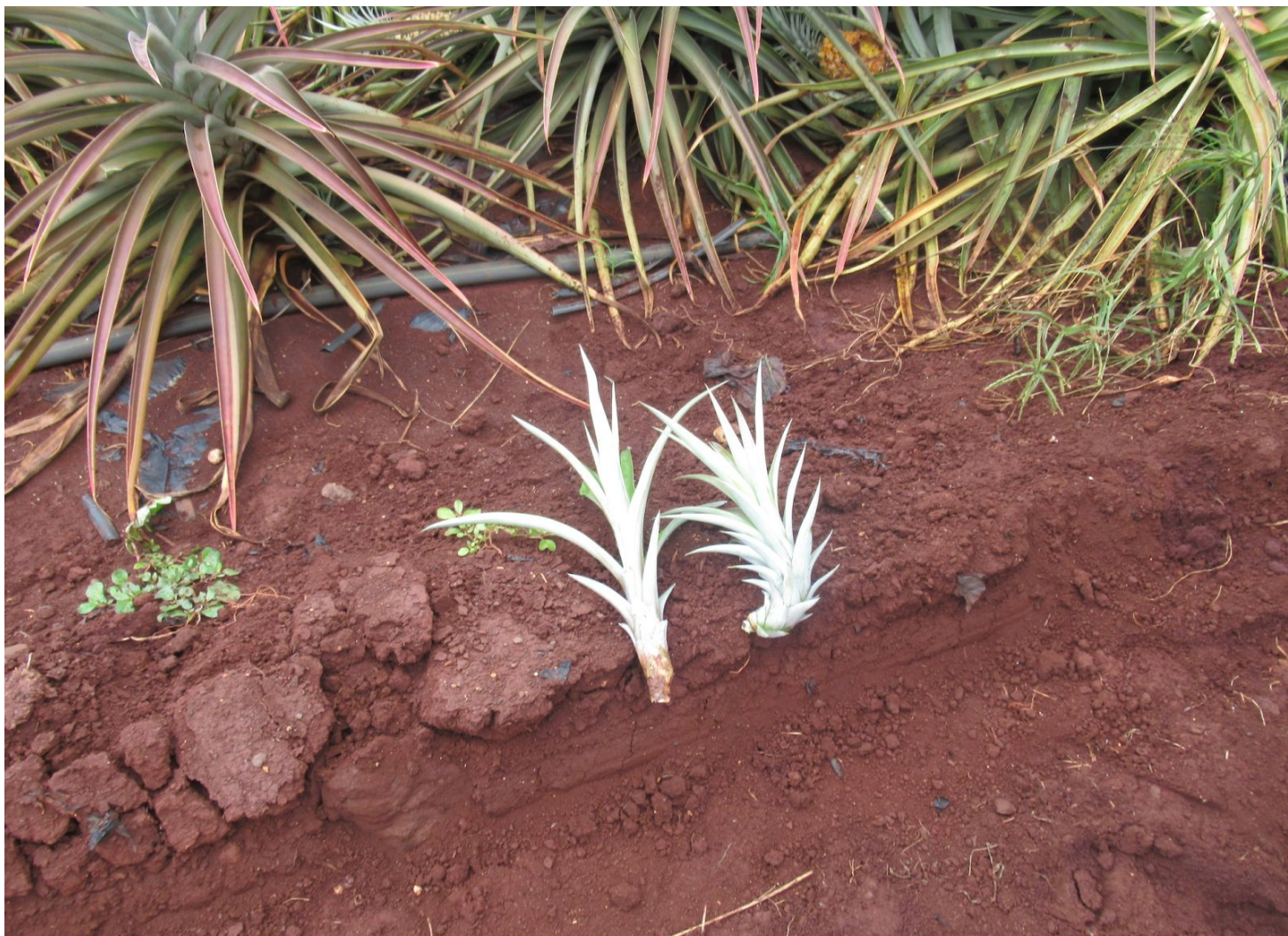
14 - SLIPS & SUCKERS שנשתלו מחדש