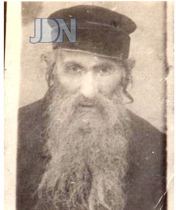
רבי יעקב דוד מראדומסק