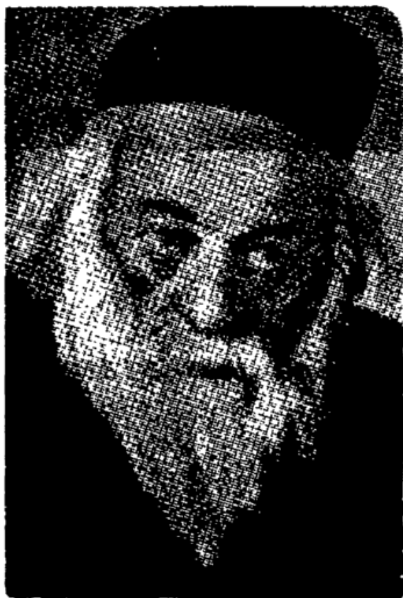
הגאון רבי חיים מבריסק זצ"ל

כאשר עזב הגרי"ל דיסקין את לומזא ועבר לשקלוב, עזב גם ירוחם פישל את הישיבה בלומזא, ועבר לבריסק לשמוע תורה מפי רבי חיים רבה וראש