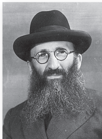
מרן המשגיח הגרא"א דסלר זצ"ל, ה"מכתב מאלהו"

כאשר באמנה איתו. באופן זה העביר בישיבה את כל קיץ תשי"א, וכך החל גם את חורף תשי"ב. באחד הימים הראשונים של זמן חורף, בעודו יושב והוגה בגמרא בהיכל הישיבה, חש על כתפו יד... היה זה ראש הישיבה מרן הג"ר דוד פוברסקי זצ"ל, שבשר לו בהערכה גלויה כי "לך מגיע להיכנס לישיבה"... כך נכנס למנין בחורי הישיבה.