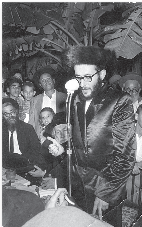
מרן הרב מפוניבז' ומרן הרב שך זצוק"ל מאזינים לדרשת הרב החתן

ההנהגה החילונית, הלך מספרם של שומרי המצוות בעיר והצטמצם מאד יחסית לכלל התושבים. אך כל זה לא הניא את הרב לשנות כקוצו של יו"ד מהנהגת הרבנות ו"להתקרב" לחילוניים או לשומרי המצוות למחצה לשליש ולרביע. שמירת מסורת הרבנות מדורי דורות הייתה בעיניו קודש קדשים, דבר שהתבטא בעמידה עיקשת בכל הנוגע לכלל וגם לפרט.