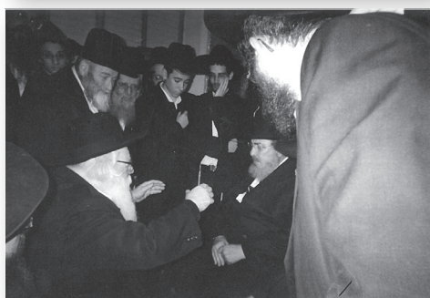
בניחום אבלים אצל רבנו