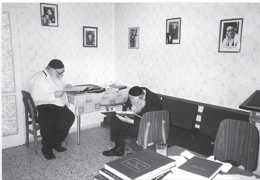
חזו בני חביבי... - בשבוע מניחות לב בקליוולנד ארה"ב, נכנס הגר"ש זצ"ל אל בית רבנו להתברך בשלום עם האם הרבנית ע"ה, ועד מהרה שקעו האחים בשיחה תורנית מעמיקה

בליל שבת קודש פרשת שמות לסדר "וילך איש מבית לוי", השיב את נשמתו