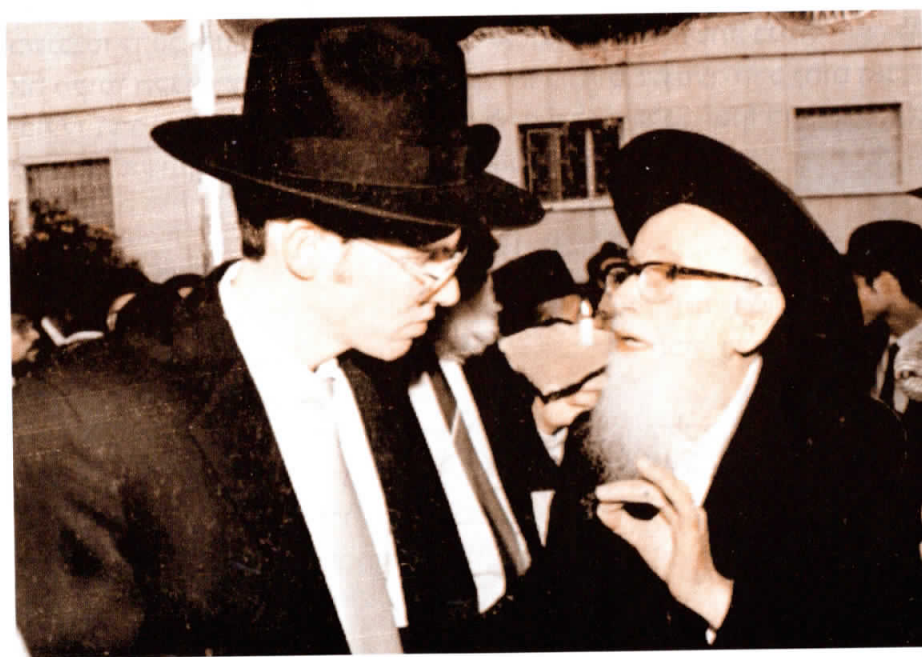
"דור לדור יביע אומר". חתן צעיר תחת חופתו, מקשיב קשב רב לדברי ההדרכה של הרב

רגיל היה הרב לומר לחתנים, לפני כניסתם לחופה: התורה אומרת: "כי יקח איש אשה חדשה, לא יצא בצבא ולא יעבר עליו לכל דבר, נקי יהיה לביתו שנה אחת, ושמח את אשתו אשר לקח" (דבר, כד, ה). הגבלת הזמן של "שנה אחת", נאמרה רק על אידיציאה לצבא ועל שאר עבודות הציבור. אך "ושמח את אשתו". כתוב לאחר המלים "שנה אחת"; ללמדך, ש"שמח את אשתו" – הוא חיוב הנמשך לכל החיים!!!