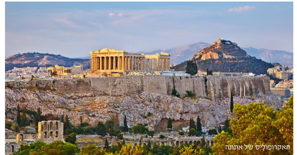
האקרופוליס של אתונה

חכמי יון ומלומדיה למדו והפיצו את החכמות בעולם אותו הם כבשו. אלכסנדר היה