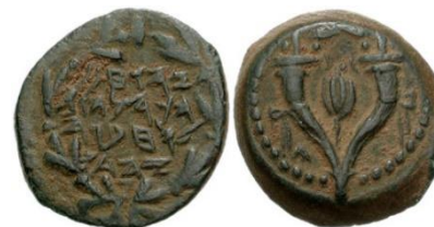
מטבע יוחנן הורקנוס

כט. אחריו קם יוחנן בנו, שהיה גם כהן גדול בבית המקדש ושימש פ' שנה בכהונה גדולה. וכבש את כל ארץ אדומאה שבנגב יהודה והכריחם להתגייר או שימיתם או יגלם. וכבש גם ארצות רבות בעבר הירדן, וגם את שכם ושומרון עד הכרמל, ואת בית שאן כבש. ואף הוא היה רואה את הצלחתם של בניו בכיבוש שומרון כשהיה לפני ולפנים ושמע בת קול.