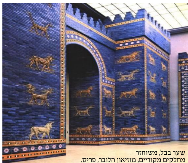
שער בבל, משוחזר מחלקים מקוריים, מוזיאון הלובר, פריס.

ב. עוד לא שמעו העם לקול השם, ואחרי שש שנים עלה על ירושלים (מלכ"ב כד א, ומגילה יא: ובפירש"י) והגלה את המלך יהויקים שמת בדרך מחוץ לירושלים וקבורת חמור נקבר (ירמ' כב יח-יט). והמליך את יהויכין (יכניה) בנו, אשר המשיך ועשה הרע בעיני השם כאביו. לאחר תשלום השנה למלכו (כשמלכותו נמשכה ג' חדשים בלבד), ואחרי שבע שנים מגלות הנערים שהגלה נבוכדנצר, עלה שוב על ירושלים (ג'שכ"ז - 3327 לבה"ע), ולקח את כל אוצרות בית ה', והגלה לבבל את המלך יהויכין ושריו וכל העם שבירושלים, ובתוכם החרש והמסגר (חכמי התורה), ומהם נביאים כחגי זכריה ומלאכי (ויכני הלך להשם לבקש רשות בביהמ"ק בצאתו לגלות ויצא דרך יכניה. שקלים פ"ו מ"ג), והשאיר רק את דלת העם והמליך עליהם את מתניה בן יאשיהו המלך, והסב שמו צדקיה, שאכן היה צדיק, אבל נכשל בעוון הדור ועבר על דברי הנביא ירמ' ומרד במלך בבל.