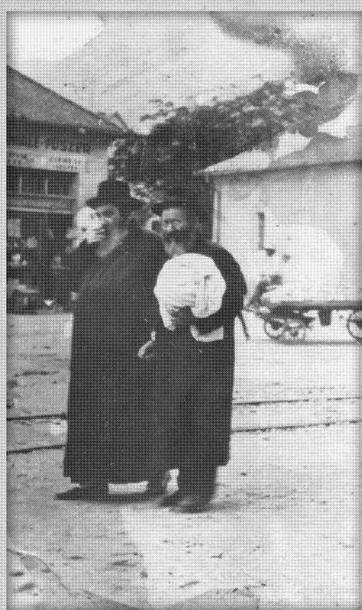
בדרכו חזרה מהמקוה המרכזי בעיר