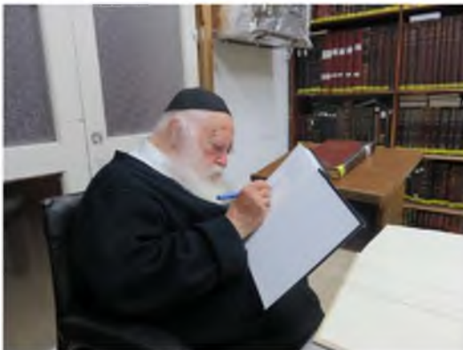
כל הזכויות שמורות ©

וְיֹאמֶר מֹשֶׁה אֶל יְהוָה בְּחַר לָנוּ אֲנָשִׁים וְצֵא הַלֶּחֶם בַּעֲמֶלְק מִחֹר (י"ז ט')