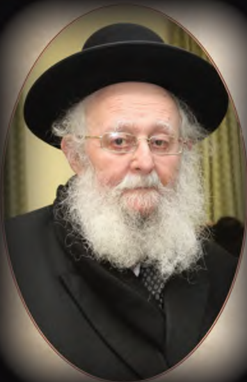
הגאון הגדול רבי שלום בן ציון פלמן זצ"ל נלב"ע י"ב שבט תשע"ה תנצב"ה