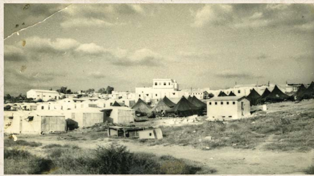
המעברות במושב הרצליה שנבנו לשכן את העולים. שם פעל רב העיר הגר"י יעקובוביץ זצ"ל לייסוד מקוה טהרה