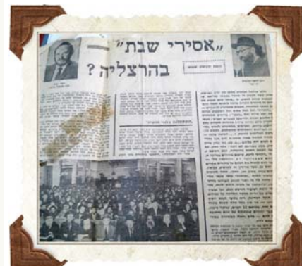
כתורות על 'אסירי השבת' בהרצליה