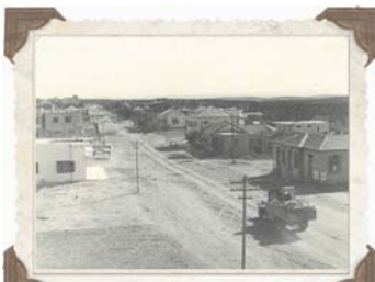
הרצליה בימים ההם. רחוב סוקולוב בו צעדו מאות המפגנים בשבת

הגר"י זצ"ל זכה לראות עולמו בחייו. הותיר אחריו ברכה, את רעייתו הרבנית החשובה שתח"י, שעמדה לימינו כל שנותיו והיתה שותפה מלאה לכל מפעליו בנאמנות אין קץ, בניו ותחניתו שליט"א, רבנים גאונים, ראשי ישיבות, מרביצי תורה והוראה, נכדים ונינים הממשיכים במורשתו המופלאה. תלמידים ושומעי לקחו ההולכים בדרכי התורה והיראה.