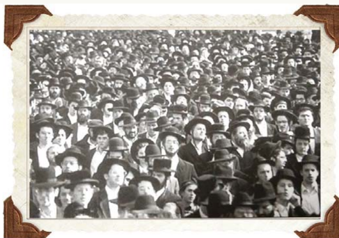
המונים השתתפו בהמגנה נגד בית המשפט בעקבות הקביעה שהרשיעה את הרבנים 'נאשמי השבת'. התמיכה שקיבל הרב מגדולי ישראל, והכרעת מרן ה'בית ישראל' ז"ע — מה לעשות כדי לא לעורר חלילה קטרוג