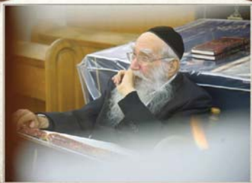
באנפון נהירין. רב מדרות קודמים

"על-כל-פנים, זכורני שציננו בצפרא דשבתא מבית הכנסת לאחר התפילה, ורבי יוסף הבחין ביהודי העומד ומשקה את גינתו. הוא נעמד ליד הגדר, ניגש ודק לעברו: 'גוט שבת, גוט שבת, גוט שבת', כך שלוש פעמים. הלה, שהיה מפא"ניק, נעמד ועצר את עבודתו. איני יודע אם עצר את עבודתו מחמת הכושה, או שנתעורר בו איזה ניצוץ, אבל הוא כבר לא השקה יותר את גינתו ביום שבת קודש".