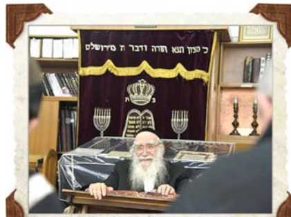
הלך כנגד רוחו של כל אחד. האיר פנים לכל אדם