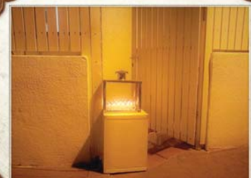
האיר את הרצליה והסביבה. תוכניה צנועה ופשוטה בפתח ביתו הפשוט של האדם הפשוט