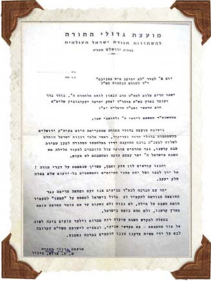
ברכת חברי מועצת גדולי התורה לרבה של הרצליה על עמידתו האיתנה על משמר שבת קדשנו...