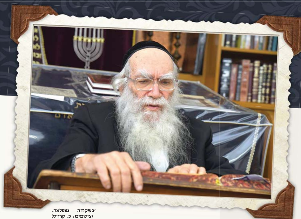
בשקידה מופלאה.

שהיתה מקשה אחת של אצילות מרוממת; טוב לב נדיר ומדות חצובות הוד ועדינות — ולא החזיק טיבותא לנפשיה.