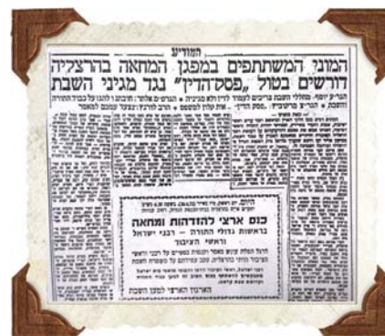
'המודיע' שופרה של היהדות הנאמנה ליווה את מאבק השבת בהרצליה לפני 48 שנה

פעמים רבות היה הרבי ה'בית ישראל' מגיע אליו לביתו בהרצליה, יושב עמו ומתעניין בכל צרכי העיר. הכשרות, המקוואות, השבת, העירוב, וכל עניני הכלל והפרט. בכל אלה הפעולות תמך בו הרבי ז"ע, עודדו וחזקו. פעם הגיע הרב לביתו נאות קודש של הרבי ה'בית ישראל' וסיפר לו על פעילות הירואית שעשה בענין הטהרה בעירו. הרבי ה'בית ישראל' הפסיק ויצא לחדר אחר, וכשחזר העניק לו סכום גדול מאוד, באומרו כי רוצה הוא להיות שותף עמו ולעזור לו בענין.