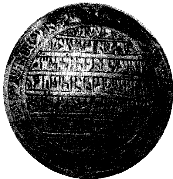
תמונה מס' 2

אכן, ברכת כוהנים עצמה נחשבה כבעלת יכולת שמירה מיוחדת וראשי תיבותיה הפכו ל"שם קדוש" השומר בפני המזיקין, וצורתה: יי יפ אוי יפא ולש 10 . ויש והיא מופיעה במלואה בקמיעות שמירה 11 , יחד עם פסוקים אחרים, כגון ראשי תיבותיו של מזמור קכ"א: "שיר למעלות אשא עיני אל ההרים", שבו הפסוקים "הנה לא יגום ולא יישן שומר ישראל. ה' שמרך ה' צלך על יד ימינך... ה' ישמרך מכל רע ישמר את נפשך. ה' ישמר צאתך ובואך מעתה ועד עולם" (ה, ה, ז, ח), ולאחר ברכת הכוהנים הפסוק הבא בבמדבר שם (ו, כו) בראשי תיבות: ואשעביוא = "ושמו את שמי על בני ישראל ואני אברכם".