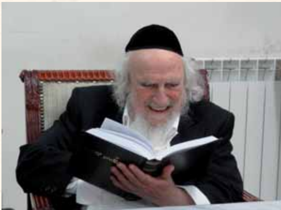
כל רז לא אניס ליה. רבינו הוגה בתה"ק

ודיוקים בלשונותיהם, והיה מוציא מזה חידושי תורה נשגבים. "יש לציין נקודה נוספת בצורת לימודו. כידוע הוא היה עמוק מאוד מאוד, ורבים לא הבינוהו, ישנם רבים שכשהם מדברים בעומק ישנה תחושה שגם הם לא בדיוק מבינים העניין לאשורו, אולם עליו ראו בחוש כי גם בתוך כל העמקות שלו עומק לפנים מעומק בעומק הסוגיות, גם כשלפעמים לא השיגו את דבריו, אולם הוא עצמו תמיד ראו עליו את ההבנה הבהירה, ראו כיצד היתה לו בהירות גמורה בנקודת החידוש בסוגיא, ובכל עומק ההבנה בזה. "זכורני באחד שהיה נחשב ללמדן גדול מאוד, אך תמיד הרגשתי