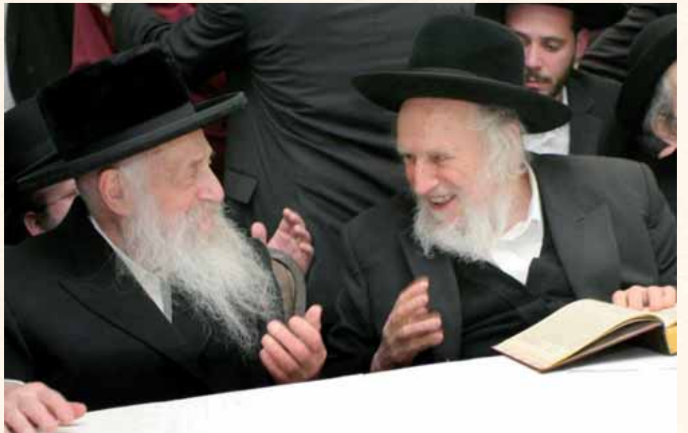
לא חש בכסף שעבר דרכו. עם מרן הגר"ש ואזנר זצוק"ל