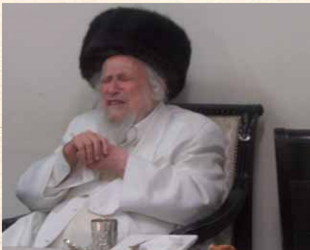
בכל עוז ותעצומות הכוח, עד כלות הכוחות. בנעילת החג בשמחת תורה