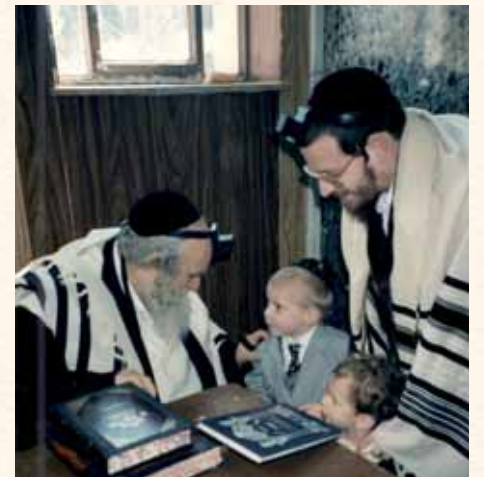
התייחסות לכל ילד וילד. עם ילדים

יכול לשאת יותר", ובכ"ז כשבא אליו אברך שנצרך לתמיכה התנצל שאמנם אין לו כסף לתת אבל מ"מ שילווח ו'ללו עלי ואני פורע'. כמו"כ סיפר תלמידו מעשה פלאי שאירע בחודש אדר תשע"ו: "הייתי באמצע ארוחת הצהריים ונקראתי לפתע לרבנו. כמוכן שמיהרתי לעלות, וראיתי אשה מבוגרת יושבת בפתח הדלת וממתינה.