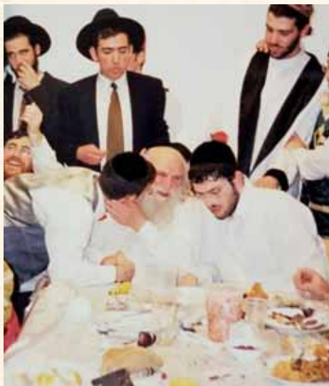
שומע סיפורי אלמנות בהשתתפות הלב. בפורים עם תלמידים

"אני נדהמתי, אלו מושגים שלא בהשגות. כל כסף