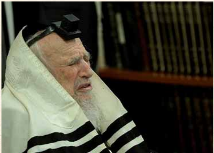
שעות ארוכות של השתפכות בתפילה לפני הקב"ה. פניו אש להבה בעבודת התפילה

"פעם", מספר תלמיד אחר, "הבחנו כי במשך שנה תמימה, עמל