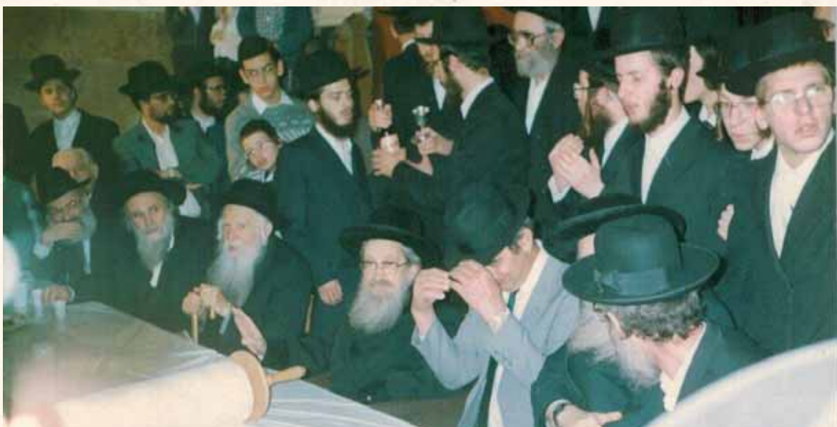
כשבא לפניו עניין של חסד לא חס על תורתו. עם כ"ק מרן אדמו"ר ה"נתיבות שלום" מסלונים צצוק"ל

רבים בארץ ובגולה ודיבר על לבם שיש בידי רשימות ארוכות של נצרכים ואלמנות שהוא חייב לסייע בעדם... פעמים רבות אף היה מכתת רגליו גם לעת זקנותו ממש מבית לבית בירושלים בבתי הנדיבים בכדי לדבר על לבם, וכך היה מצליח לסייע בידי שבורי הלבב כל פעם מחדש. "בד בבד, כל העת טרח עבורם בכדי להוסיף עוד ועוד סכומים