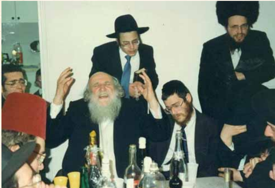
חם ליבי בקרבי. בפורים עם תלמידים

"...זכינו להתפלל בצלם של שני ענקי עולם, מרנא הגרש"ז ובנו רבנו, כל אחד בצורת התפילה שלו משני צדי ארון הקודש, הגרש"ז בריכוז הנורא והשקט, ורבנו בסערה הנוראית שאפפה את תפילתו. ואנו צעירי הצאן, רואים צורת תפילה מה היא..."