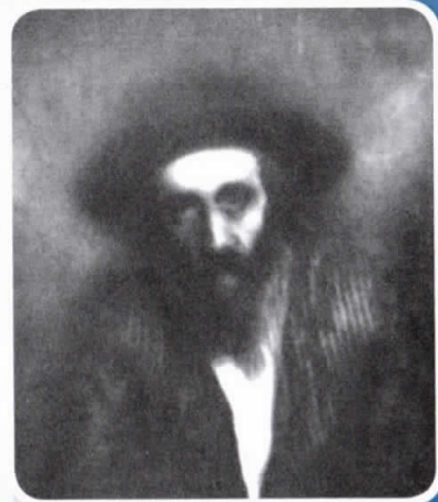
הרה"ק רבי אהרן ראטה זי"ע

הייתי פעם בשולחן הטהור בליל שבת קודש אצל הרה"ק רבי אהרן ראטה זי"ע, בעל 'שומר אמונים' ומייסד החבורה הקדושה בירושלים. זכורני את המעמד המרומם שנגלה נגד עיני, כשכולם היו לבושים בקאפטן הירושלמי הזהוב. רובם ככולם היו עניים מרודים שבקושי השיגו את פת לחמם כל ימות השבוע, חלק היו מחלקי חלב וחלק היו נגרים, אבל בבוא שבת קודש לא הכירו עליהם כלום, השבת בערה אצלם בכל עוז ותעצומות. אשרי עין ראתה זאת.