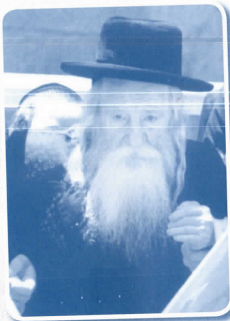
הרה"ק רבי יודאלי מדז'יקוב זי"ע

אך מטרה נוספת היתה לו בנסיעתו זו, לפעול אצל יהודים וחסידים במדינות הים לסייע לו להגשים את חזונו משכבר הימים אחרי המלחמה, להקים שיכון חסידי ולחדש את מלכות בית ויז'ניץ המפוארה על אדמת ארץ הקודש.