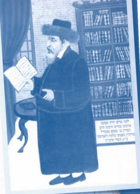
דמות קדשו של מרן ה'צמח צדיק' זי"ע