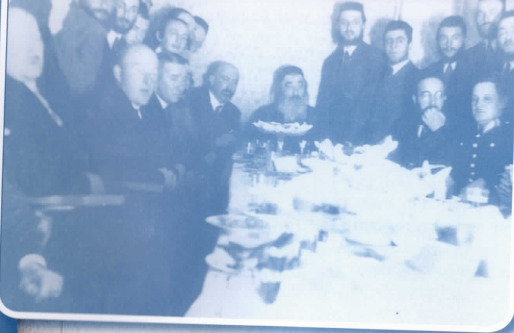
מרן הסב"ק זי"ע עם בכירי ממשל בפולין

השגותיהם של האחים הק' מרנן בעל 'אמרי חיים' ובעל 'מקור ברוך' זי"ע באביהם הק' מרן הסב"ק בעל 'אהבת ישראל' זי"ע היתה כמובן