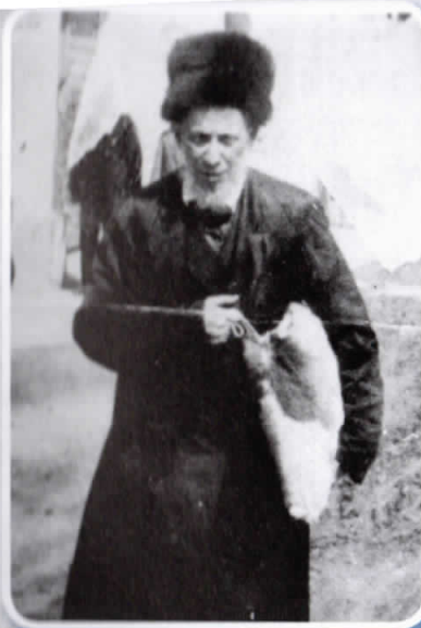
הרה"ק בעל 'חקל יצחק' זי"ע מספינקא