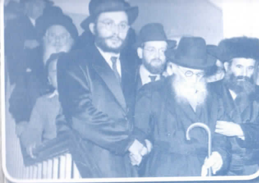
הגה"ק בעל 'חזון איש' זי"ע בשמחה משפחתית

כך עברו עלינו חודשי החורף של שנת תש"ט, כשאני מחפש לעצמי מקום להתחבר אליו לתוספת רוחניות.