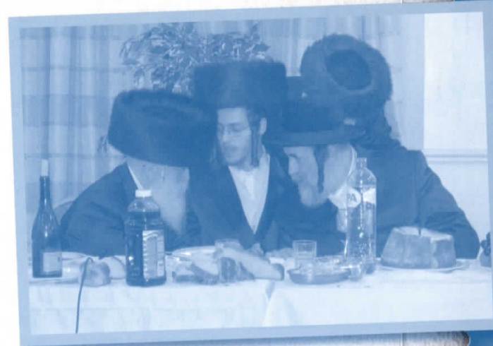
בשיחה עם מרן אדמו"ר מויז'ניץ שליט"א מארה"ק