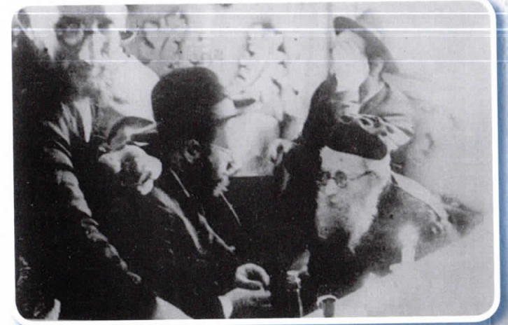
הגה"ק בעל 'חזון איש' זי"ע עם מקורבו