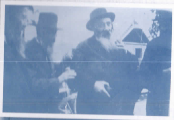
מרן הסב"ק זי"ע בקהל חסידים