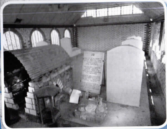
מצבת רבותינו הק' בעל 'צמח צדיק' זי"ע ובעל 'אמרי ברוך' זי"ע בויז'ניץ

סיים רבנו ה'אמרי ברוך' ואמר: "לפי גודל הענווה שהייתה לאבי