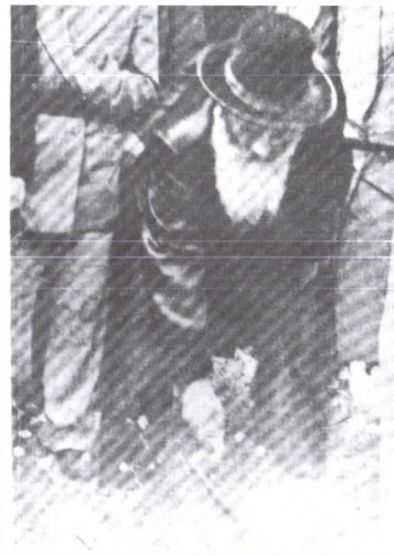
מרן ה'אמרי חיים' זי"ע מניח את אבן הפינה לשיכון