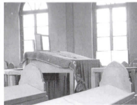
בימת הקריאה בבית הכנסת המרכזי