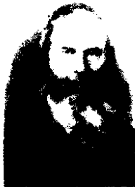
ז"ל רבינו הגדול רבי יצחק אייזיק ז"ל רבינו הגדול רבי יצחק אייזיק Founded 1908 by the late Grand Rabbi Ch.J.L. Averbach

71 RASHE ST. POB 193 JERUSALEM 91001 ירושלים 193, ק"ק חסידים טל' 02-5381677 TEL 02-5381677 פקס 02-5381656 FAX