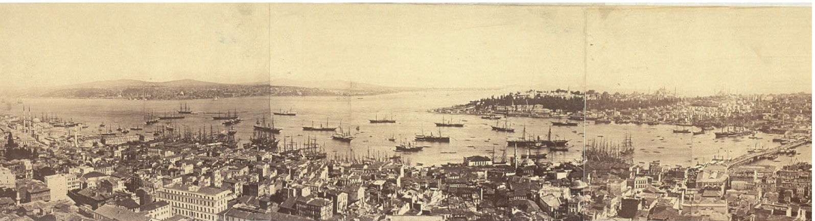
איסטנבול בזמן ביקורו של הבעש"ט

המעשים נאדרי הקדושה הללו מופיעים כאמור כהצדעה לאחד המיוחדים מידידי עונג שבת החפץ בעילום שמו שהוא מוציא בימים אלו את 'הגדה של פסח בעל שם טוב' - אוצר בלום המכיל כ-650 עמודי גושים ומלאים ליקוט נפלא מאמרות קדשו של אור שבעת הימים רבינו הבעל שם טוב זיע"א על סדר ההגדה ממקורות נאמנים ספרי