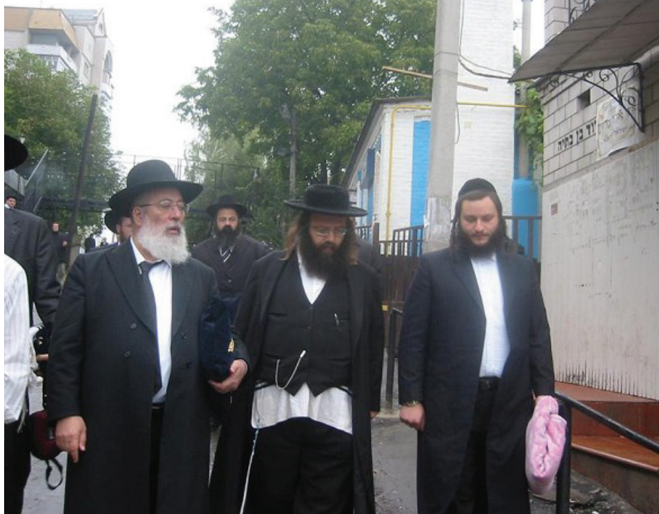
הראש"ל הגר"ש עמאר, בדרכו לציון הבעש"ט

פעם אחת הלך הבישוף עם בן המלך ברחוב היהודים, וראה כי הרמב"ן הקדוש לומד עם