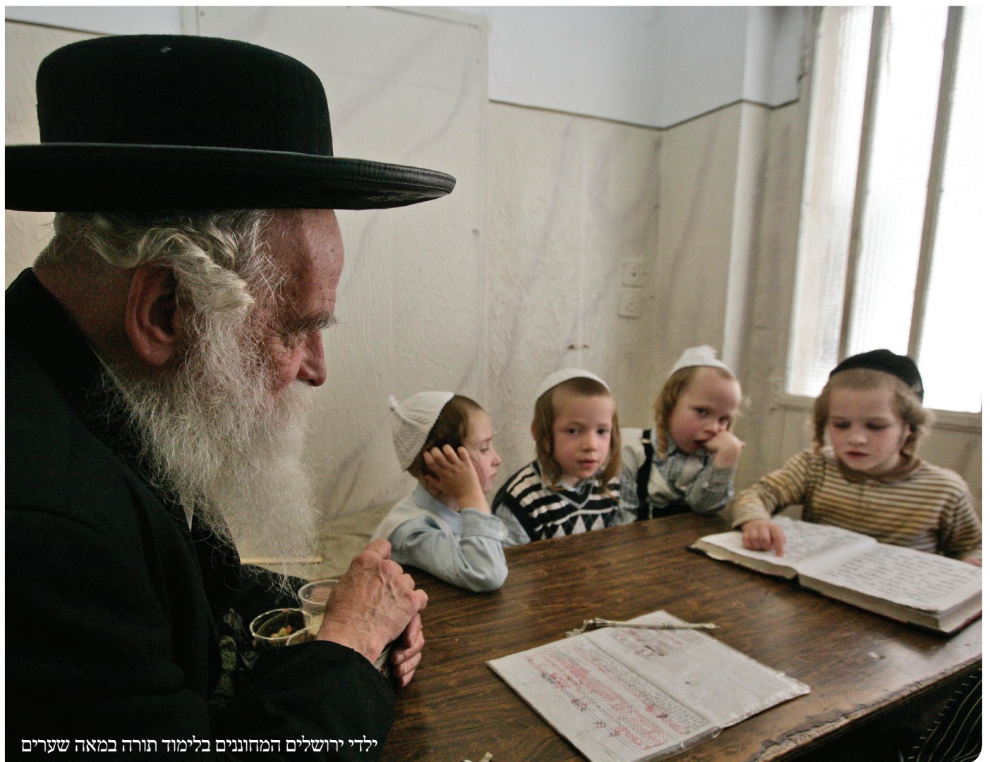
ילדי ירושלים המוחננים בלימוד תורה במאה שערים

איננו מחכים לתשובה כלשהוא ממכם, כי נעים זמירות ישראל כבר אומרו: מצדיק רשע ומרשיע צדיק תועבות ד' גם שניהם.