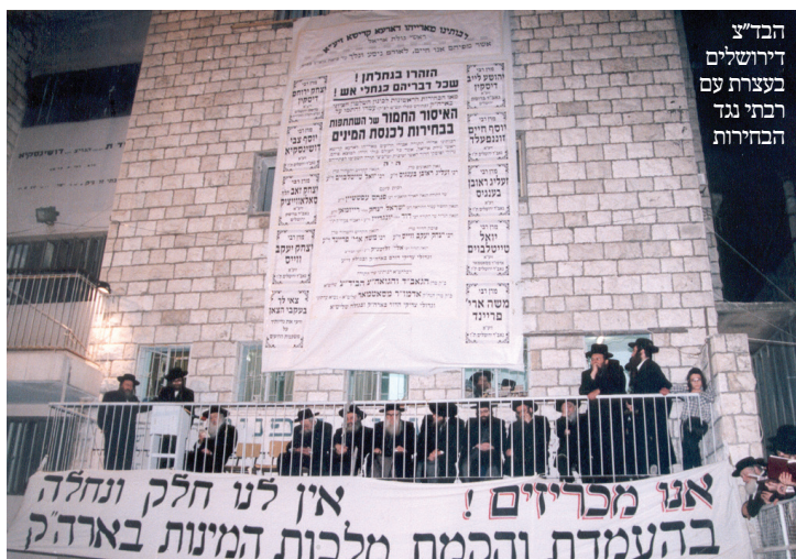
הביד"צ דירושלים בעצרת עם רבתי נגד הבחירות

בבחירות הנוכחיות, המערכה מתנהלת באופן אחר מבעבר, — המשך בעמ' 10