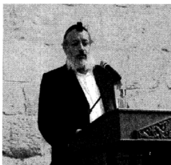
בנו הגאון רבי אליהו שליט"א