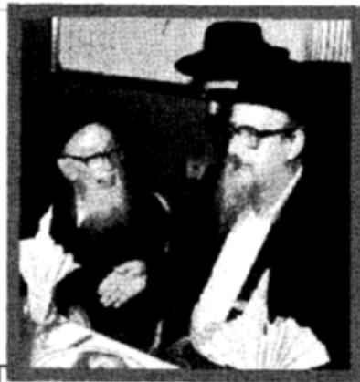
מרן הגר"י קמניצקי צוק"ל