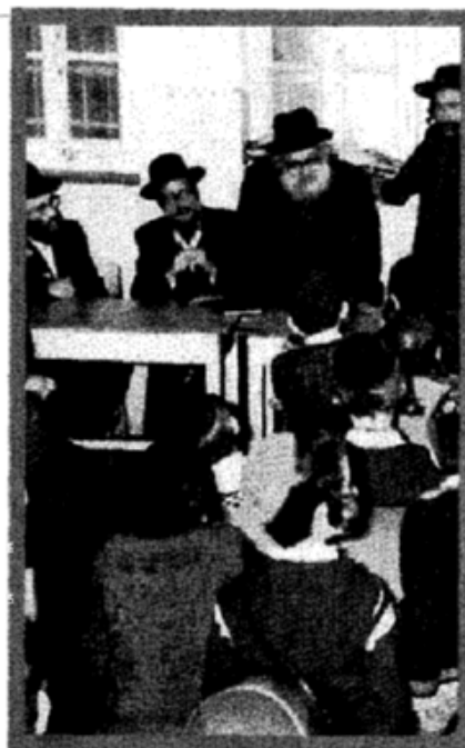
מרן הגר"י קמניצקי צוק"ל בעת בחינת בת"ת