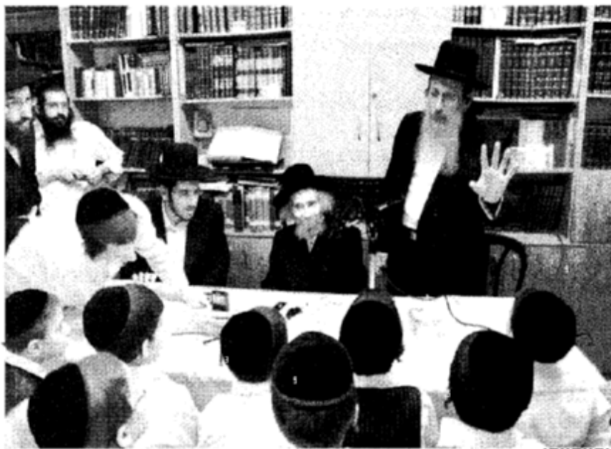
ילדי התלמוד תורה עם רבי יו"ט שליט"א אצל מרן ראש הישיבה הגר"ל שטינמן שליט"א

מה היה כוחו המיוחד שהצליח להטביע בן חותם מופלא אצל הרבים? נח"מ 1234567