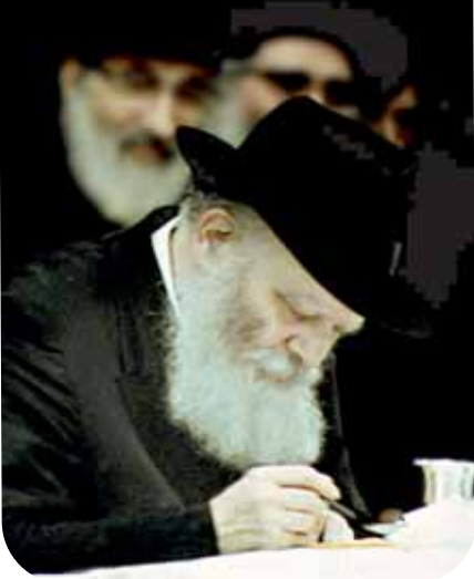
מאת הרב יהודה לייב ויסגלס