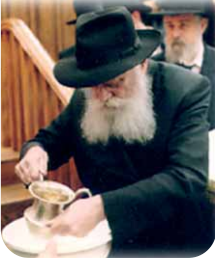
מאת הרב מאיר ערד