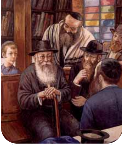
מאת הרב ישראל יצחק זלמנוב

קווים לדמותו של הרב החסיד ר' אברהם אבא ע"ה פערסאן, מחסידי כ"ק אדמו"ר הצמח צדק, אדמו"ר המהר"ש, אדמו"ר הרש"ב ואדמו"ר הריי"צ