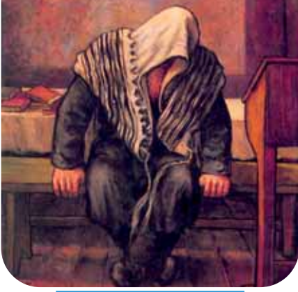
מאת הרב אליהו הנדל

האמנם יתכן לומר שהנשמה הינה חלק ממצאוות הבורא?