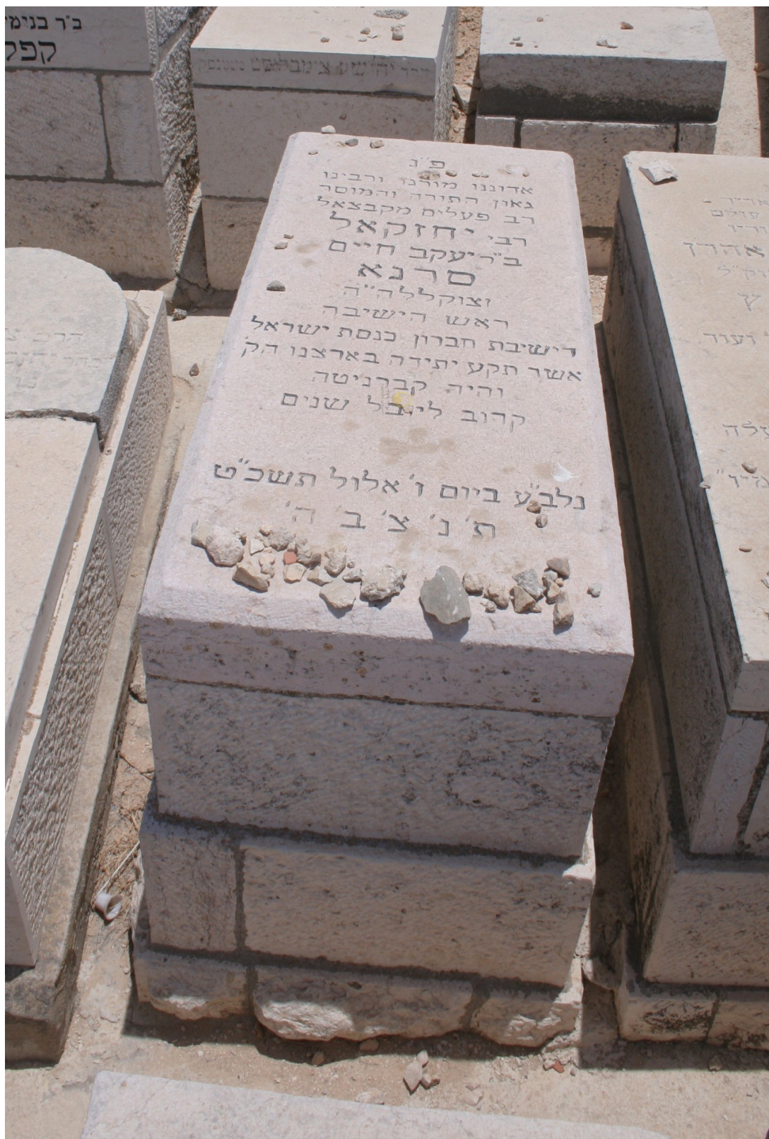
מצבת קבורת מרן ראש הישיבה זצוק"ל כ"ח שבט תר"ן – ו' אלול תשכ"ט