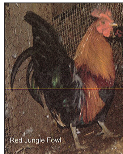
Red Jungle Fowl