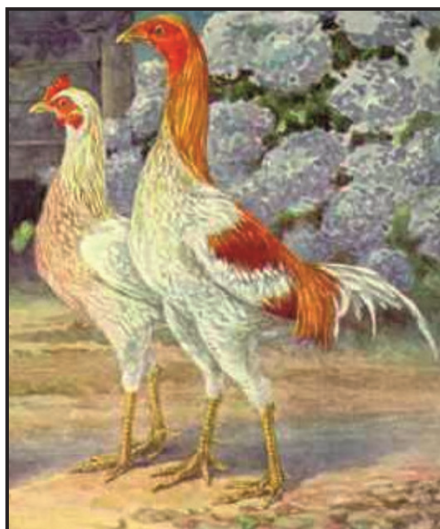
מזני תרגולי המלאי

ועפ"י קבעו המדענים שלשה איזורים כללים והם תרגולי המזרח הרחוק, אשר מאקלים ההוא נשתנה צורתו לתרגולים זקופים [כהמלאי], והשני תרגולי אירופה, אשר האקלים מגדל תרגולים הארוכים וקטנים [כהלענהורן] והשלישי תרגולי אסיה שצורתם מרובעים [כהקוצין].