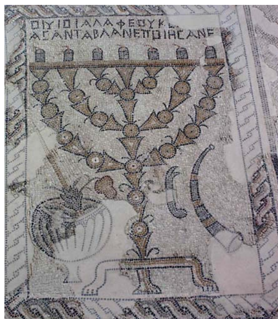
תמונה 98: ציפורי. פסיפס, צד ימין (קטעים משוחזרים מופיעים ברקע בהיר). | שופר, מלקחיים, מנורה, אתרוג ואגד לולב