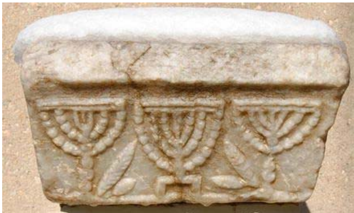
תמונה 102: קורינתוס (יוון). כותרת עמוד מעוטרת שלוש מנורות, וביניהם שני אגדי לולב ואתרוג