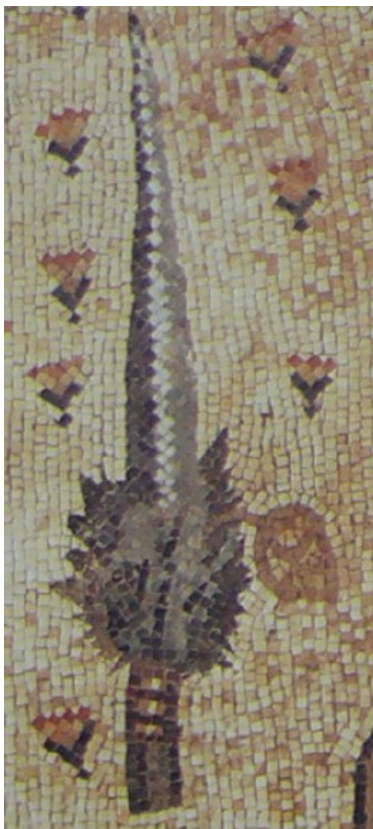
תמונה 97: חמת טבריה. פרט מהפסיפס אגד הלולב השמאלי