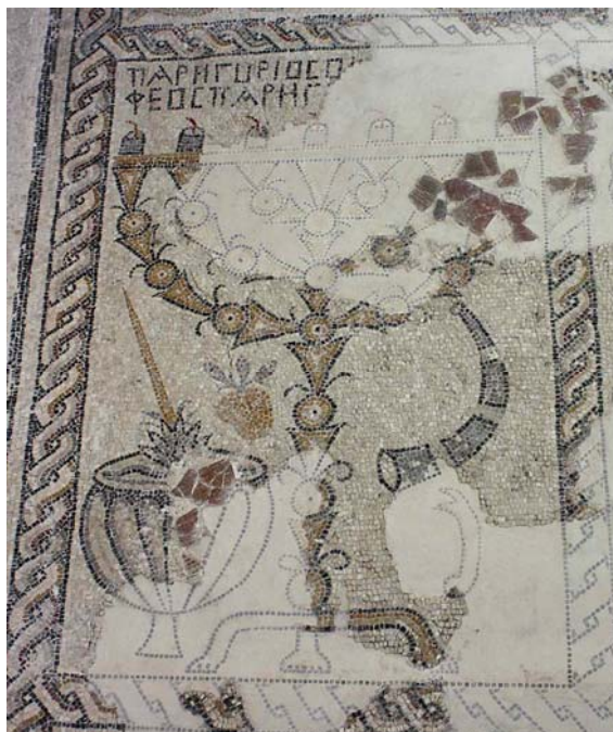
תמונה 99: ציפורי. פסיפס, צד שמאל (קטעים משוחזרים מופיעים ברקע בהיר). | שופר, מלקחיים, מנורה, אתרוג ואגד לולב