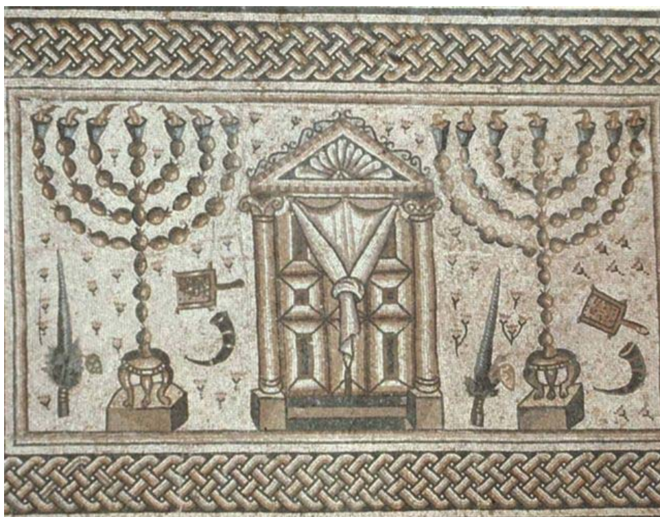
תמונה 95: חמת טבריה. פסיפס חזית אדריכלית ומשתי צדדיה מנורה, שופר, מחתה ואגד לולב