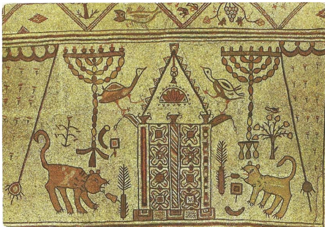
תמונה 94: בית אלפא. פסיפס חזית אדריכלית, ומשתי צדדיה: מנורה, אריה, מחתה, שופר ואגד לולב