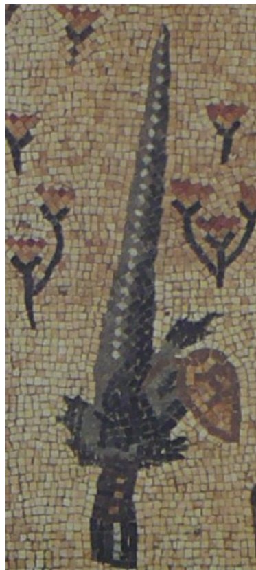
תמונה 96: חמת טבריה. פרט מהפסיפס אגד הלולב הימני