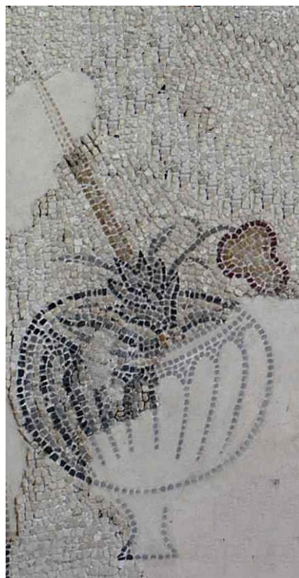
תמונה 100: ציפורי. פסיפס (פרט מתוך השטיח הימני) אתרוג ואגד לולב