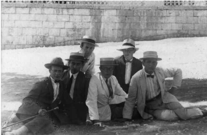
קבוצה מתלמידי הישיבה בזמן טיול בעיר חברון ב'אשל אברהם'

הישיבה בחברון התבססה וגדלה בהדרגה במספר תלמידיה. בשנת הלימודים תרפ"ה למדו בישיבה 126 תלמידים. בתרפ"ו 156; בתרפ"ז 151; בתרפ"ח 173; ובתרפ"ט 194 תלמידים. בתרפ"ט נקלטו 42 תלמידים חדשים בישיבה, לעומת 21 שעזבו. חלק מהתלמידים הוותיקים עלו עם הישיבה מחו"ל, ואליהם הצטרפו ילידי הארץ וכאלה שבאו מאמריקה. יחסית ליישוב הישן של אז היו התלמידים מודרניים בלבושם ובמחשבותיהם, הם קראו עיתונים והיו מחוברים לחיים בארץ 20 .