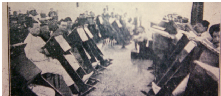
בית המדרש השוקק בישיבת 'כנסת ישראל' בחברון