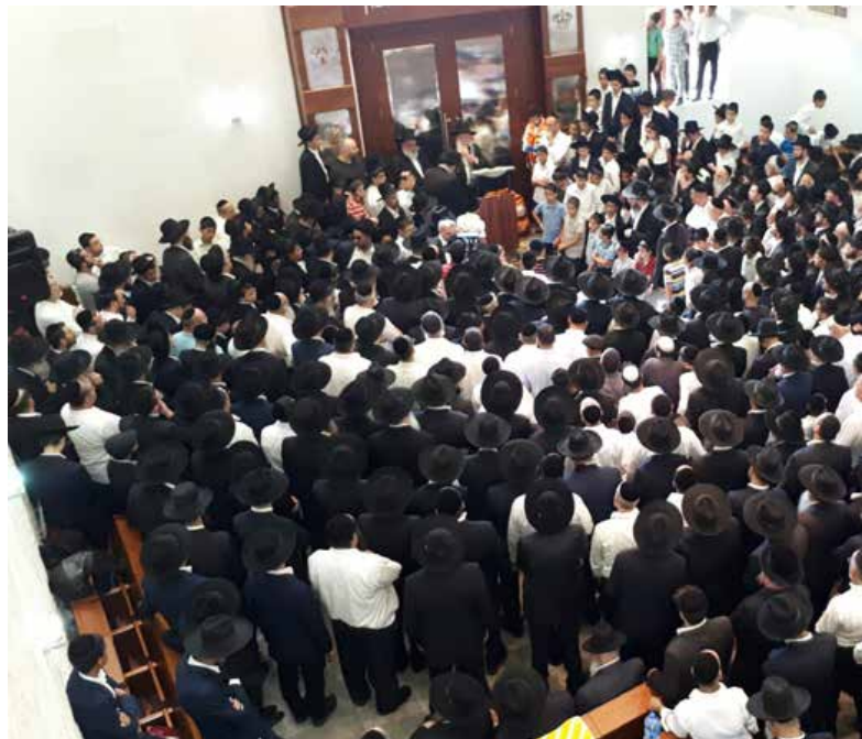
וכבוד עשו לו במותו. ההמונים במסע ההלוויה

יש היום תשעים בחורים. "הגלגל כל כך מהר הסתובב עד שהיום זה ביוזין לבחור ארגנטינאי שלא הולך ללמוד בישיבה. יש משפחות שלמות ששם שלוש דורות ללמוד בישיבה בזכות המהפכה. הסבא, האבא והבן. זה חומר ארגנטינאי!"