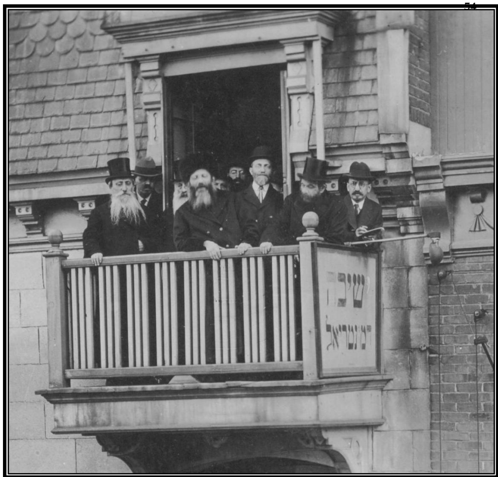
הגראי"ה, הגרא"ד הגרמ"מ על גזוזטרה בישיבת מונטריאול [הראי"ה נואם בפני הקהל הנמצא למטה]