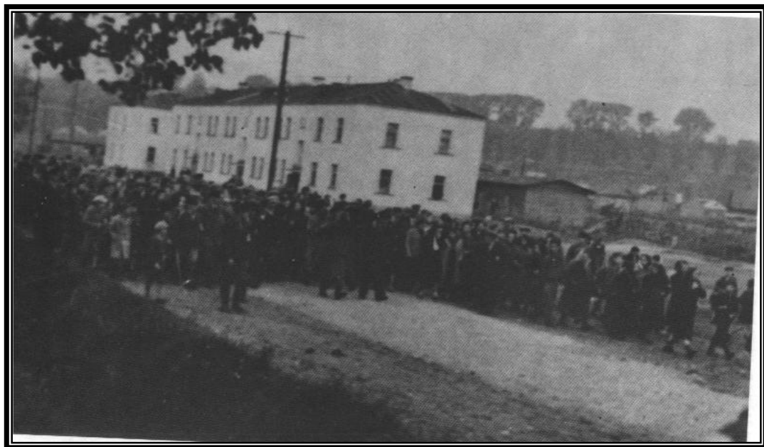
לויית הגרא"ד שפירא זצ"ל הי"ד בגטו קובנה