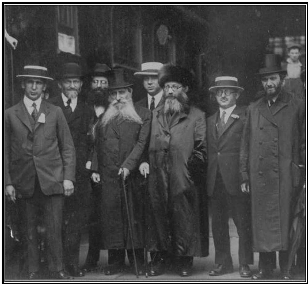
במסע הרבנים לאמריקה