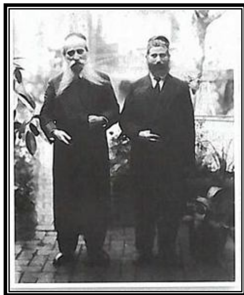
הגרא"ד, במסע לאמריקה עם הרה"ג רבי אליעזר סילבר