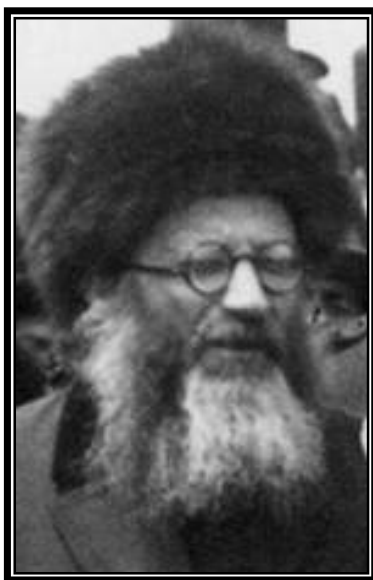
הגרא"י הכהן קוק זצ"ל