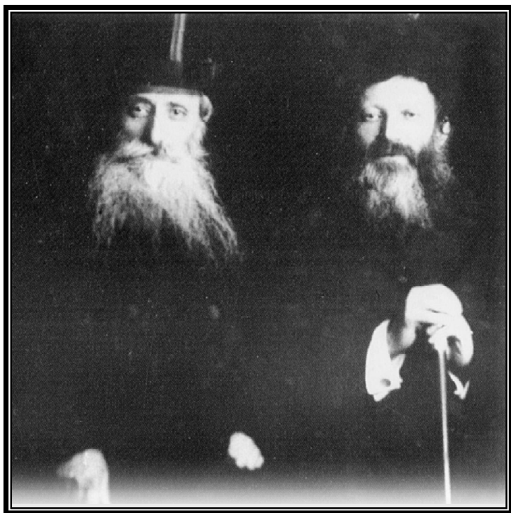
במסעם המשותף לאמריקה