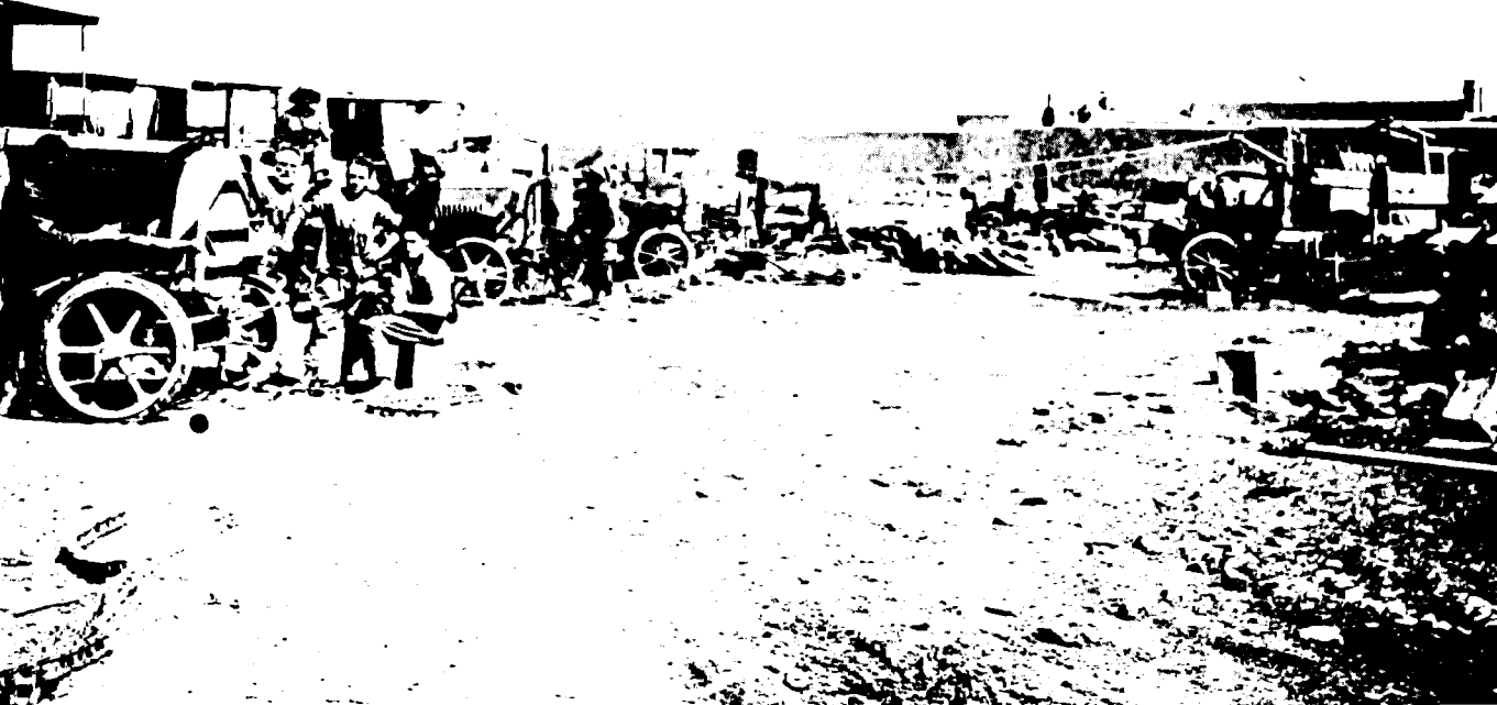
מוסד' בתל-אביב, שנת 1920 בקירוב

את המכס אי-אפשר היה בגלל התחייבויות הקשורות בחוק העזת'מאני, אך מטרתה העיקרית של המדיניות היתה להתגבר על המחסור העצום בבתיים למגורים.