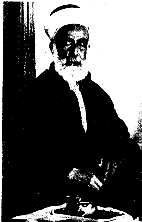
חסין, שריף מכה

סמכותו של פיצל תוכר בכל השטחים הנמצאים בשליטתו מזרחה לירדן. השטחים שמצפון צופים אליו. אנו יכולים לאשר לו את הכרתנו גם אם כוחותינו אינם נמצאים עתה בכיבוש מחוזות נכבדים מזרחה לירדן. 18