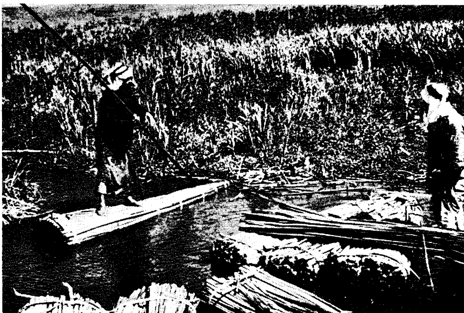
קוטלי קנים בחולה, 1935

ההנהגה הפוליטית הערבית לא השלימה עם מסירת הזכויות ליהודים ותבעה את הקרקע לכפריי הסביבה. בחודש מארס 1935 תבעה המועצה המוסלמית העליונה מן הנציב העליון בשם התושבים הקמת משתלה חקלאית במחוז החולה; ייסוד בתי-ספר בכפריהם והענקת הקרקעות המיובשות שמסביב למימי החולה 'הואיל ויש להם צורך גדול בהן'. 45 כאמור, שטח הזכויות הקיף 57,000 דונם. לאחר מסירת 15,000 דונם לערבים (ולמען הדיוק: 15,772 דונם) עתידים היו להישאר בידי היהודים פחות מ-42,000 דונם ובכללם 5,000 דונם שטח האגם לאחר שיצומצם היקפו. לפי התכנון נועדו אפוא להתיישבות יהודית 37,000 דונם בלבד. ייבוש הביצה והקטנת האגם (למעשה, יובש האגם כולו) לא היה בהם כדי להבריא את העמק כולו ולהפכו לאיזור פורה ונוח להתפתחות יישוב תרבותי. שטחי העמק הצפוניים, שהיו מרוחקים מן הביצה ומן האגם, סבלו ברובם מהיעדר ניקוז ומהצטברות שלוליות וכצעימים שנתמלאו בשנים גשומות (והעמק משופע במשקעים). הפיצו קדחת, מנעו עיבוד רצוף של הקרקע ויצרו איים גדולים של אדמה מבאשה, ששימשו מסתור למזיקים לחקלאות. היה הכרח אפוא להשלים את ייבוש שטח הזכויות בייבוש ובהכשרת חלקו הצפוני של העמק כולו. מוסדות התנועה הציונית ניהלו משא-ומתן ממושך עם ממשלת ארץ-ישראל. זמן קצר לפני פרוץ מלחמת-העולם השנייה פרסמה הממשלה הודעה רשמית בדבר הקצבת 235,000 לירות-ארצישראליות להכשרתו ולהבראתו של צפון עמק-