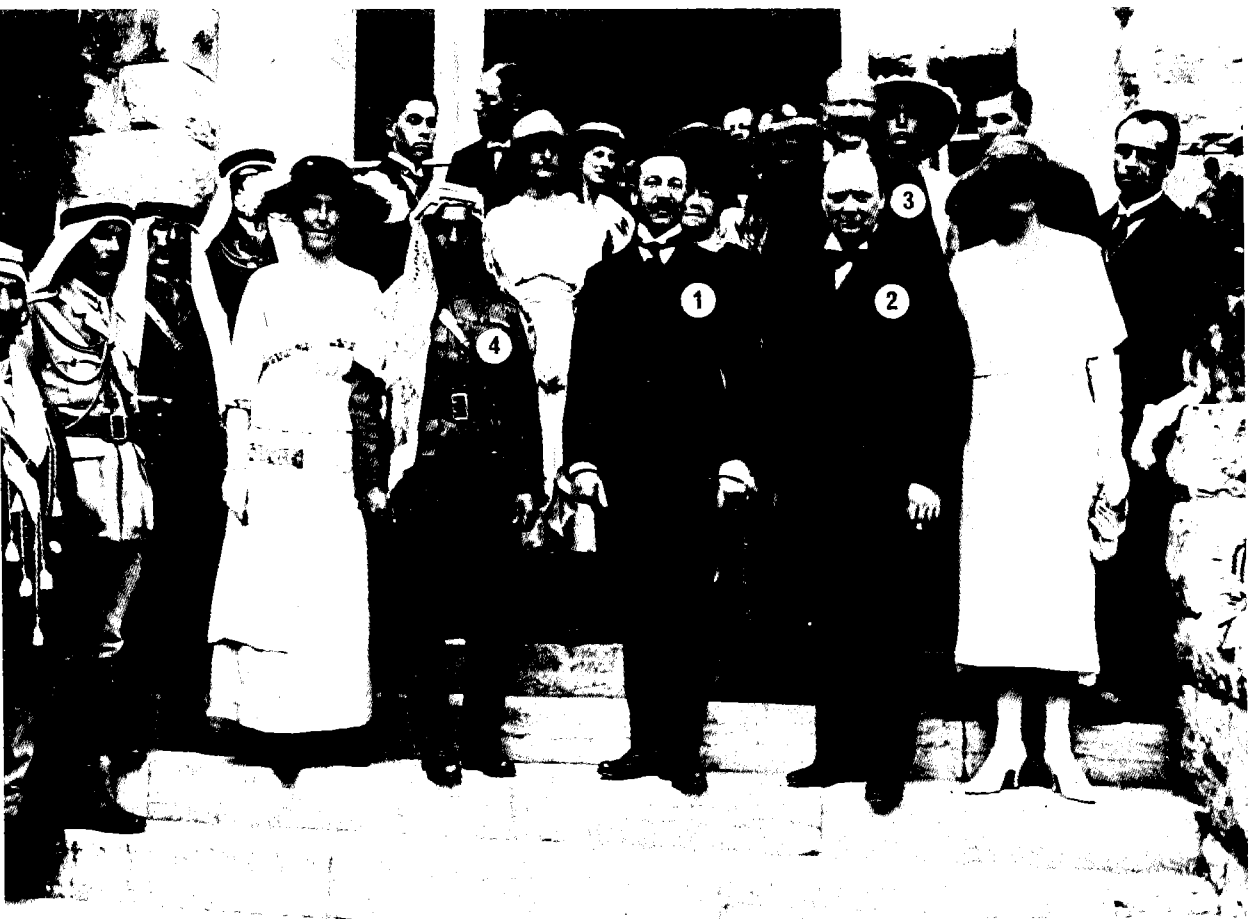
בעת ביקורו של וינסטון צ'רצ'יל בירושלים, אפריל 1921. (1) סר הרברט סמואל; (2) וינסטון צ'רצ'יל; (3) סר רונאלד טורס; (4) עבדאללה