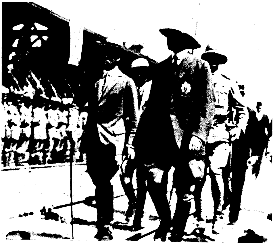
הרברט סמואל במעמד חנוכת הרכבת ביפו, 1921

מערכת התחבורה — מסילות הברזל. רק בתחום אחד היתה מערכת התחבורה הארצישראלית מפותחת יחסית בשעה שסמואל נתמנה נציב עליון — מסילות הברזל. הכבישים היו מועטים וגרועים ומספר כלי הרכב הממונעים קטן. נמליה של ארץ-ישראל היו כולם פתוחים