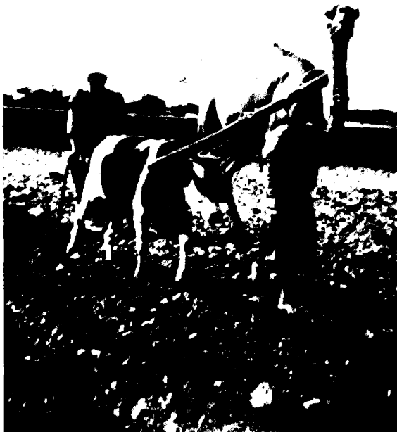
חקלאות ערבית פרימיטיבית: חריש בגמל ובפרה, שנת 1920 בקירוב

הדואר, הטלגראף והטלפונים לידי הממשל האזרחי וכבר ביולי דיווח סמואל על הפעלת שירותי דואר ניסיוניים בחלקים שונים של הארץ ועל פיתוח מואץ של רשת הטלפונים. 41 בין יולי 1920 לדצמבר 1921 הושקעו על חשבון המלווה הארצישראלי 379,259 ל"מ במסילות הברזל (בשלושת החודשים הראשונים של 1922 הגיע הסכום ליותר ממיליון ל"מ, מאחר שבוצעו תשלומים עבור קרונות וקטרים ועבור הפקעת קרקעות), 332,456 ל"מ בכבישים (חלק מהסכום הזה הוצא במשך הזמן מרשימת המלווה והוכנס לתקציב השוטף) ו-88,270 בדואר, בטלגראף ובטלפונים. 42 בניית החשתי, ניהול הרכבות ושירותי התקשורת והקמת מבנים לשימוש הממשלה והצבא היו התחומים היחידים בשטח הפעילות הכלכלית שהממשלה לקחה על עצמה במלואם. בכל אחד מן התחומים האחרים, החקלאות, ניהול המשאבים הטבעיים, התעשייה, הבנקאות, ענף הבנייה והמסחר, היתה התערבות ממשלתית מסוימת, אך בסך הכל הם הושארו בידי היזמה הפרטית או בידי גופים כמו ההסתדרות הציונית. סמואל מצא לנכון לציין, שחלק גדול מן הפיתוח הכלכלי בארץ חייב להישאר בידיים פרטיות, וזאת משום שאין בידי האדמיניסטרציה האמצעים הכספיים והאנושיים לעסוק בכל התחומים. 43 גם אם היו לממשלה אמצעים גדולים יותר, לא היתה מתערבת הרבה יותר בענפי המשק השונים. יש לשער שסמואל היה משקיעם בשירותים ציבוריים וסוציאליים ובתשתית, או שהיה מקטין את שיעורי המסים והמכסים. מדיניות הממשלה הוצגה בצורה ברורה וחד-משמעית על-ידי הררי, ראש המחלקה למסחר ותעשייה, שטען שמדיניות האדמיניסטרציה הינה להתערב פחות ככל האפשר ביזמה הפרטית. 44