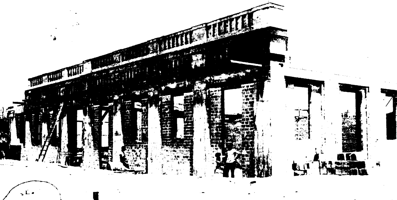
בית-החרושת ללבנים 'סיליקט' בבנינו, תל-אביב 1921

היסוסים רבים וזאת לאור רצונה של לונדון לעודד את השתתפותו של גוף כלכלי יהודי לא-ציוני בפעילות כלכלית בארץ. בעיות שונות גרמו לדחיית הענקת הזיכיון להפקת חשמל מן הירקון עד 1923 ומן הירדן — עד 1926. זיכיון על ים המלח הוענק רק ב-1929. חשוב לציין שכל אחד מן הזיכיונות נתן לממשלת ארץ-ישראל אפשרות לפקח על פעולותיהם של בעלי הזיכיונות ועל מחירי מוצרים.