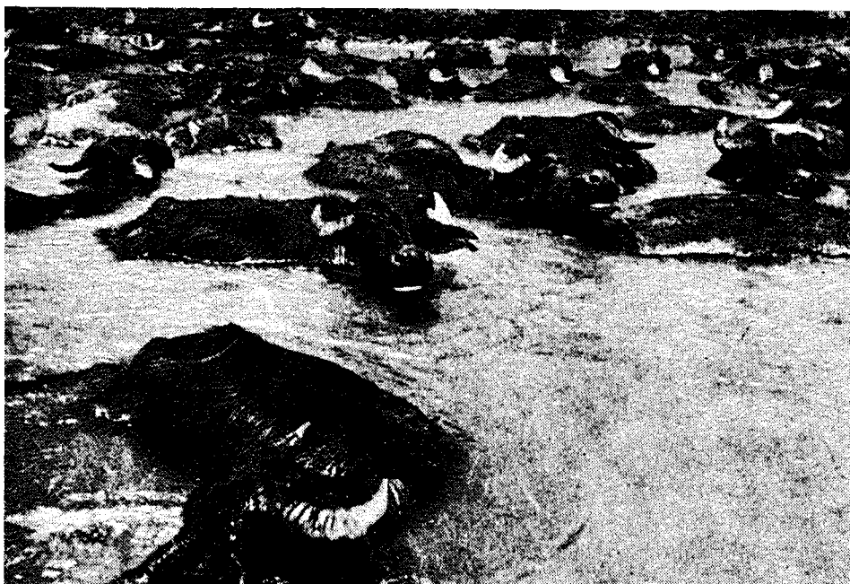
תואים בחולה, 1935

ממשלת ארץ-ישראל, ה"צ לוק, למשרד-המושבות את ההסכמה העקרונית של הממשלה בירושלים לחדש את הזכיון לחברה הסורית-העות'מאנית וביקש את אישור המשרד להתחיל במשא-ומתן על ההסכם החדש. האישור ניתן לו, למרות חוות-דעתו השלילית של המזכיר המשפטי, וב-24 בדצמבר 1928 התחיל המשא-ומתן בין הצדדים. 37