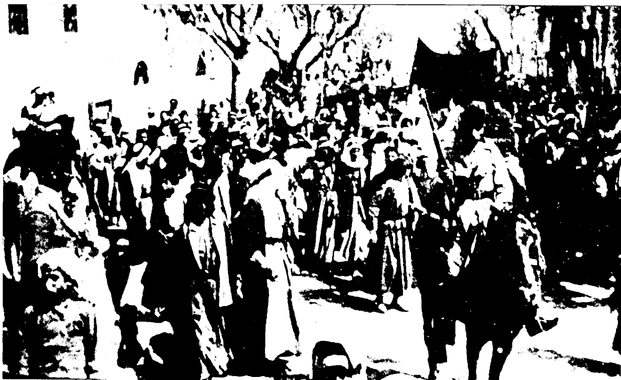
הפגנה של ערביי בית-שאן נגד הרברט סמואל, 1921. המפגינים נושאים דגלים שחורים

הם סירבו להודות בבעלות המדינה על הקרקע והצהירו כי מעולם לא הכירו בשלטון העות'מאני ובזכותו להפקיע את אדמתם.