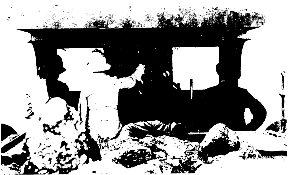
הרברט סמואל נוהג את הקטר בעת חנוכת הרכבת ללוד, 5 באוקטובר 1920

שקישר את ארץ־ישראל עם עבר הירדן, אך עבר בתחום השיפוט של סוריה. לחישמול הרכבת שבין יפו לירושלים לא היתה התנגדות עקרונית, אך ההצעה נדחתה מסיבות כלכליות. 30 במשך שנת 1921 התברר שממשלת מצרים אינה מעוניינת במסילה שבין קנטרה לרפיח. 31 מכיוון שבשביל ארץ־ישראל היה זה עורק תחבורה חשוב, שקישר אותה עם מצרים, היתה זו הנהלת הרכבות הארצישראלית שלקחה על עצמה את ניהול הקו תוך הסכם עם משרד המלחמה ומאוחר יותר עם האוויריה הבריטית. בעניין המסילה שבין צמח לדרעה עמדו הצרפתים על כך שקטע זה יישאר בשליטתם, וממשלת ארץ־ישראל נאלצה לוותר, על אף אי־הנוחות והבעיות שנגרמו בשל סידור זה. 32 בנוסף לבעיות המיוחדות לכל קו, עמדו לפני רשת המסילות בכללותה בעיות כלליות. בתחילת 1921 מנה סמואל חלק מהבעיות הכלכליות שעמדו לפני הנהלת הרכבות: מחיר גבוה לפחם, מחסור בקטרים, קרונות ומבנים, ואיכותם הגרועה של קטעי מסילה שונים. 33 על הבעיה הראשונה (שהיתה זמנית, מכיוון שמחיר הפחם בשוק העולמי ירד בהדרגה) התגברו על־ידי העלאת תעריפי הנסיעה ב־50%. כדי להתמודד עם שאר הבעיות ביקש סמואל להקציב סכום ניכר מהמלווה הארצישראלי לפיתוח מסילות הברזל. עוד לפני שהגיע ארצה כנציב עליון, ביקש סמואל לשלוח מומחה מלונדון, כדי באוקטובר 1920, ואפילו לפני שהגיע ארצה כנציב עליון, ביקש סמואל לשלוח מומחה מלונדון, כדי לסקור את מצב הרכבות ולייעץ לאדמיניסטרציה היכן וכיצד לבצע את ההשקעות הנחוצות ברשת. סקר ראשוני נערך עוד ב־1920 בידי שלושה פקידים מחברת הרכבת המצרית ולפי הערכתם היה