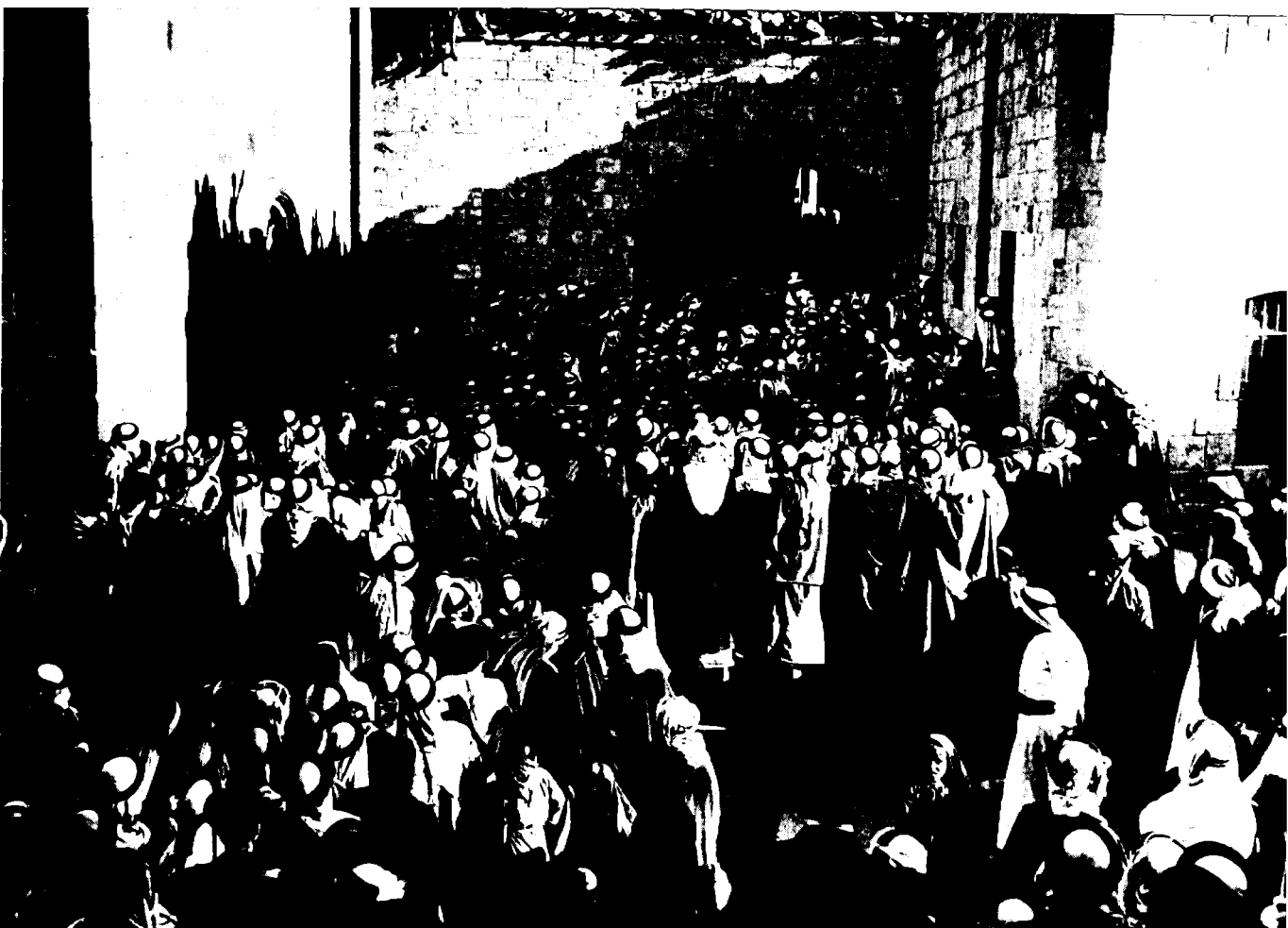
פגישת הרברט סמואל עם הנכבדים הערבים בא־סלט, 1920

והגנה עצמיים, מותנים בהסכמת האוכלוסייה. משום כך הוזמנו נכבדי המחוז מעג'לון שבצפון עד טפילה בדרום לאסיפה בא־סלט. 65