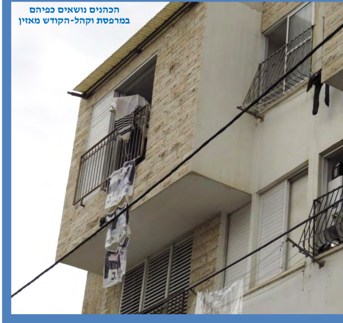
הכהנים נושאים כפיהם במרפסת וקהל-הקודש מאזין

בכל ארצות פזוריהם, שגם בגיא צלמות לא שכחו את בוראם.