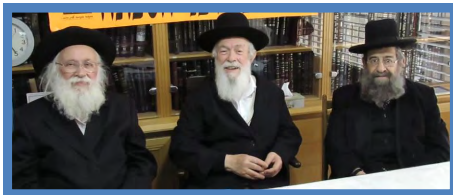
מתי? מתי נזכה שוב להתאסף יחדיו ולהאזין לדרשותיהם של מורינו ומאורי-דרכנו?

בארמונו של המלך, ומי שהוזמן לארמון המלוכה - צריך להביא לשם אוכל!! - - - וכי אין באוצרותיו של המלך די והותר כדי לפרנס אותו ואת כל בני ביתו, וכל הבאים אחריו,