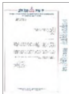
פניית ארגון 'יד שרה' לראש המכון הגרל"י הלפרין זצ"ל בדבר שיתוף פעולה לתכנון וייצור משאבות חלב לשימוש למהדרין בשבת

יתירה מזו, ישנן משאבות חשמליות, אשר ניתן להימנע בהן מכל פעולה אסורה, באמצעות חיבורן לשעון שבת מבעוד יום, אשר יכבה ויפעיל את המשאבה בשעות ידועות מראש. בצורה זו, מלבד שבעיית הפעלת מכשיר חשמלי בשבת נחסכת, היא גם פותרת את בעיית איסור החליבה עצמה. שכן אם מחברים את המשאבה לגוף לפני הפעלתה, וחוגרים אותה לגוף בבגד או בחגורה, כך שבשעת השאיבה אין צורך להחזיק את הגביע ביד, הרי שלאחר מכן כאשר המשאבה מתחילה לפעול אין זה נחשב כפעולת האשה.