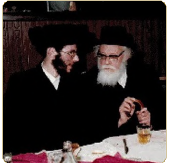
ראש המכון הגרמ"מ הלפרין שליט"א בשמחת נישואיו. בשיח תורני עם עמוד ההוראה מן הגר"ש אלישיב זצ"ל

רש"י (שם) מפרש זאת מלשון הרמה וגדולה: "לבעבור נסות אתכם, לגדל אתכם בעולם... נסות, לשון הרמה וגדולה, כמו הרימו נס (ישעיה סב, י), ארים נסי (שם מט, כב), וכנס על הגבעה