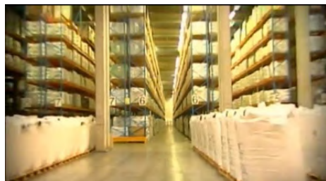
מפעל "גדות" תעשיות ביו-כימיות במפרץ חיפה על מקומו של מפעל "מיילס" שפשט את הרגל

בסופו של דבר, אכן נסגר המפעל, בעקבות חסימת השוק המקומי בפניו, וכל ההשקעה שהושקעה בו ירדה לטמיון. במשך הזמן נמכר המפעל לגורמים אחרים, והוא פועל עד היום תחת השם 'גדות', תעשיות ביו-כימיות, ליצירת חומרי גלם שונים, לאו דווקא גלוקוזה ומלח לימון.